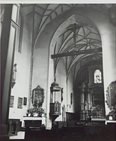
Widok na ołtarz główny