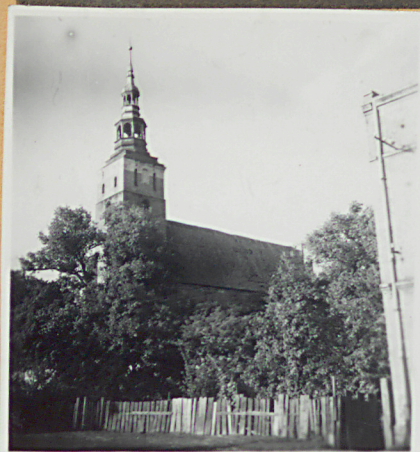
Widok od pd-zach.