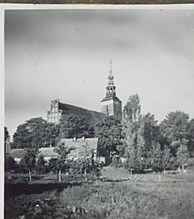
Widok od pu-wsch.