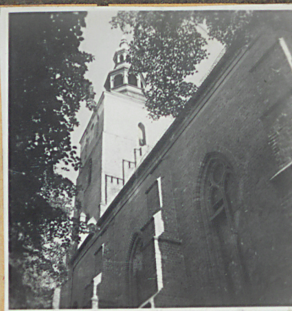
Fragment elewacji pd