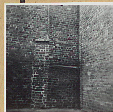
Fragment nawy pomiędzy wstę i kopiec pu