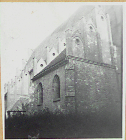
Str. pu - kopiec