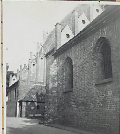
Strona pu: zakryta i trzym. kopiec