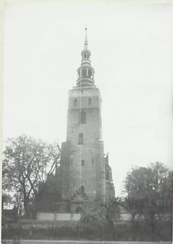
fot.2 widok na wieżę od zachodu