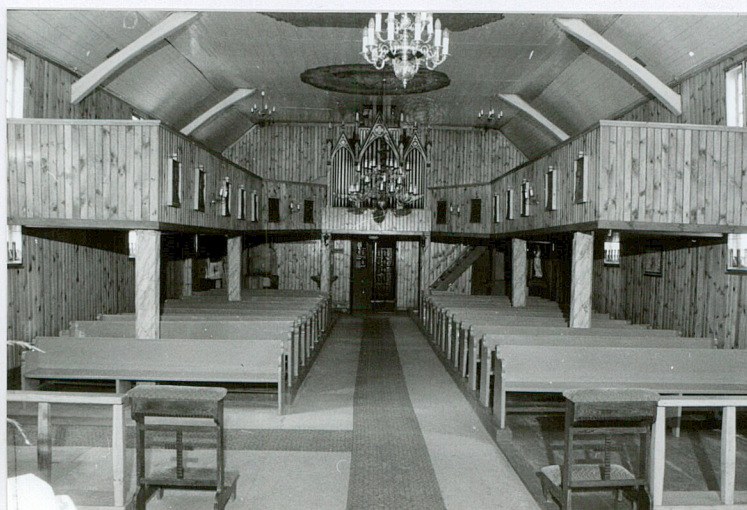
Wnętrze, widok w kierunku empy organowej.