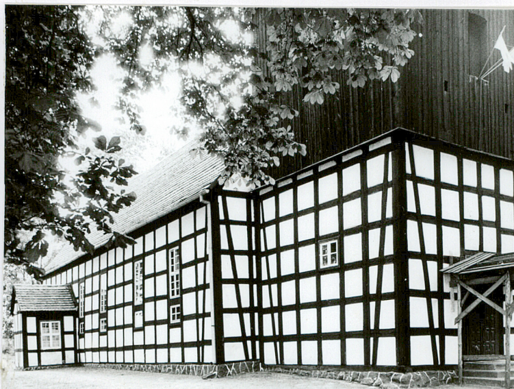
Widok od pn-zachodu