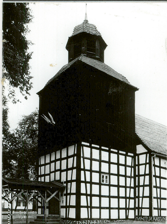
Widok od pd-zachodu.