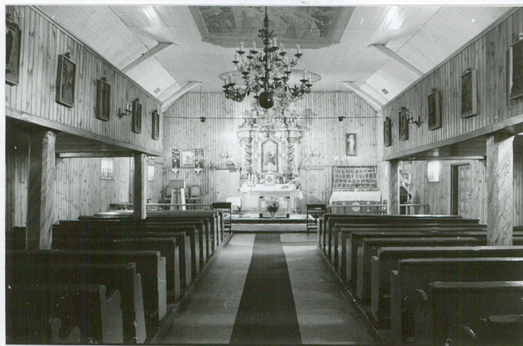
Wnętrze, widok w kierunku ołtarza