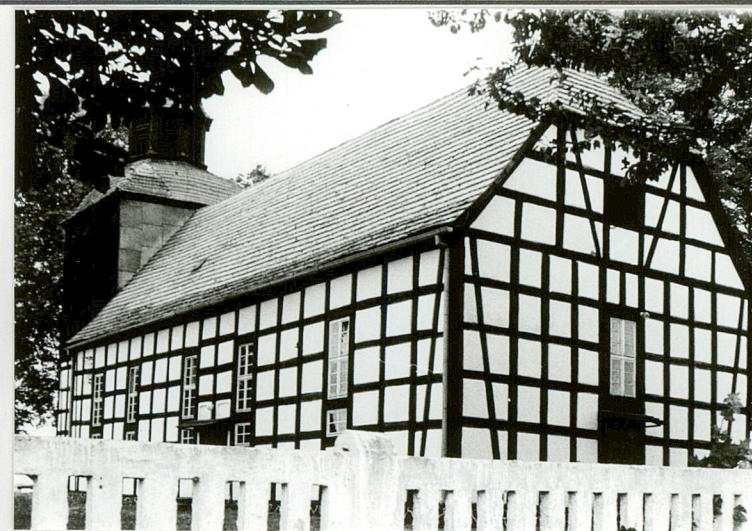
Widok od pd- wschodu