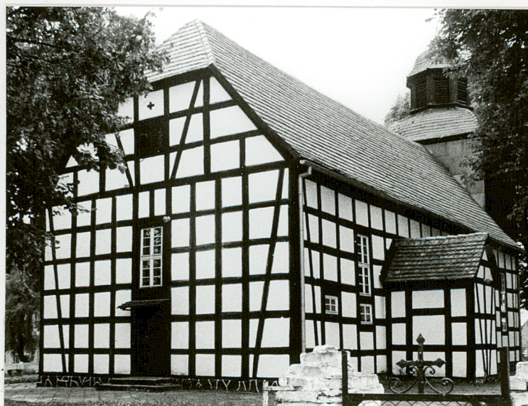
Widok od pn- wschodu