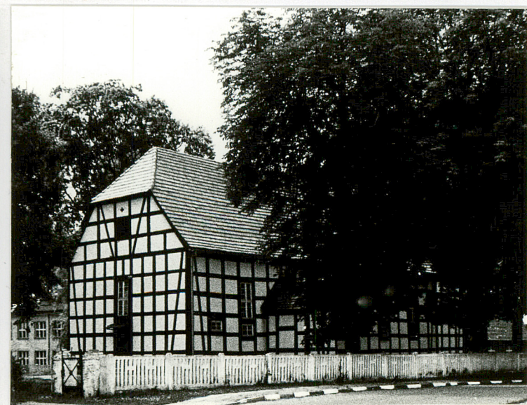
Widok od pn- wschodu.