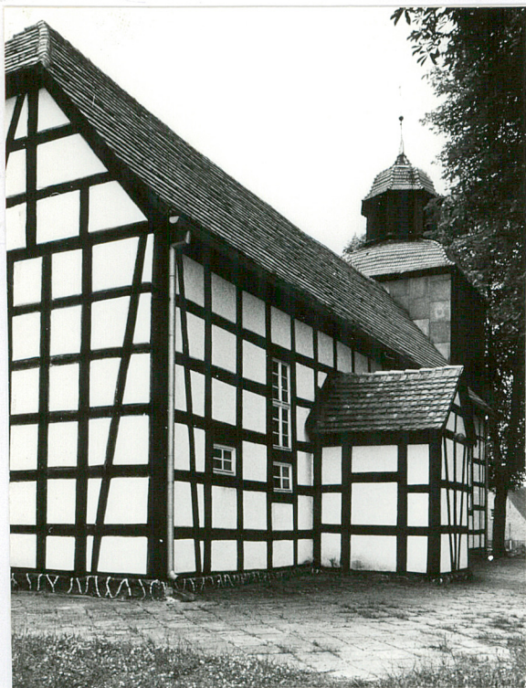
Widok od pn-wschodu.