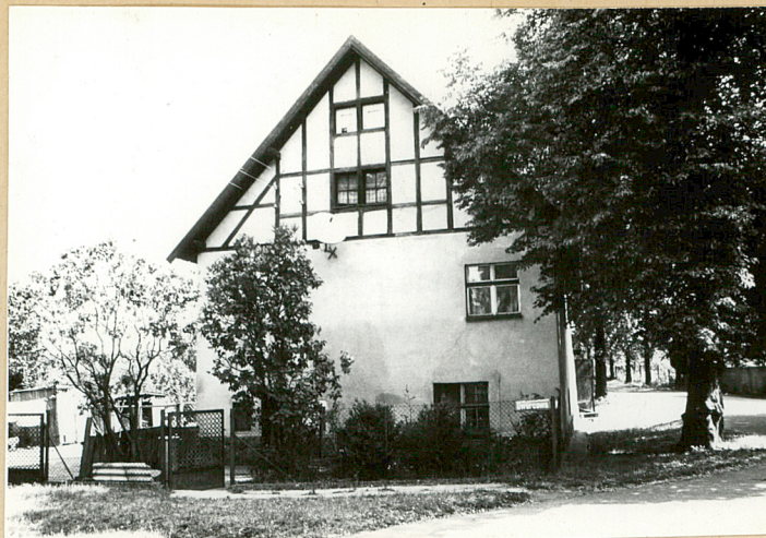
widok od str. pd