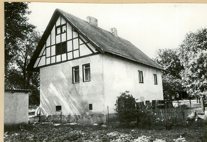
widok od str. pn - zach