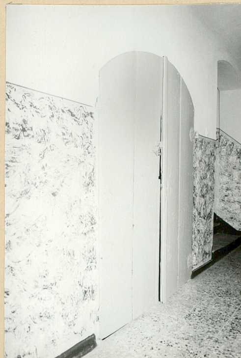
← Drzwi do pomieszczeń pod klatką schodową