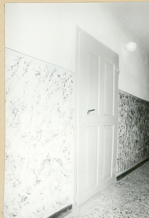
↑ Drzwi mieszkalne