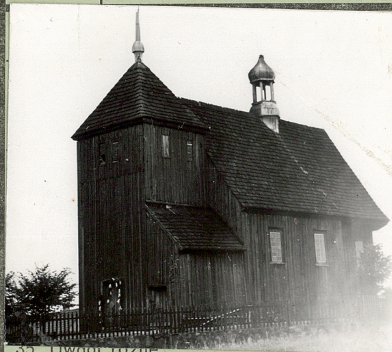
35. Widzi różne kol. 1966