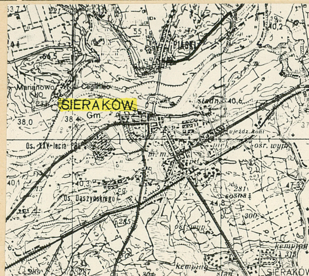
Plan orientacyjny 1:100 000