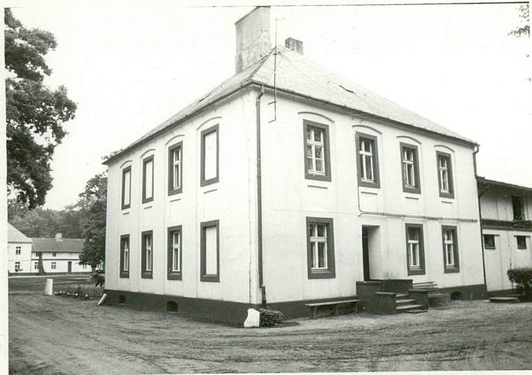
fot. 1 - widok od pn.-zach.