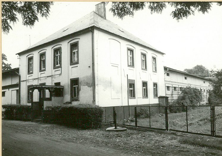
fot. 1 - widok od pd.-zach.

11. Zdjęcia, rzut, przekrój, sytuacja, orientacja