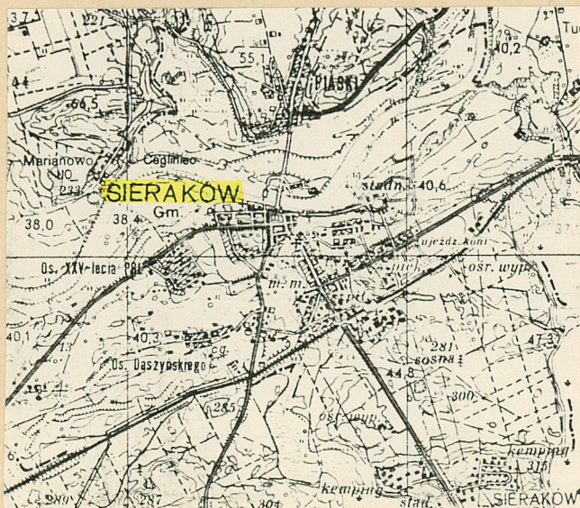
plan orientacyjny 1:100 000