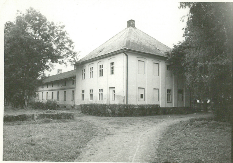
fat. 1 - widok od pn.-wsch.