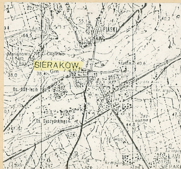
plan orientacyjny 1:100 000