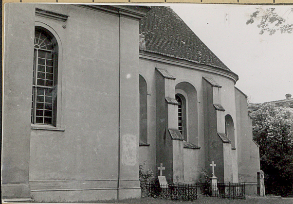
KOŚCIÓŁ PARAFIALNY pw. Świątów św. JANA