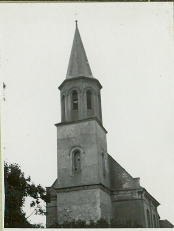
31. Szkic sytu