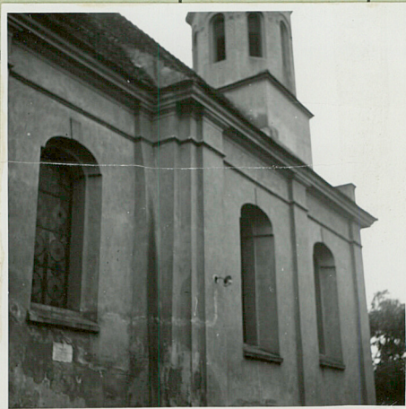
36. Wypełnił dnia