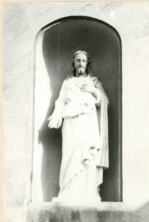
fot. 8 - nisza z figurą Chrystusa