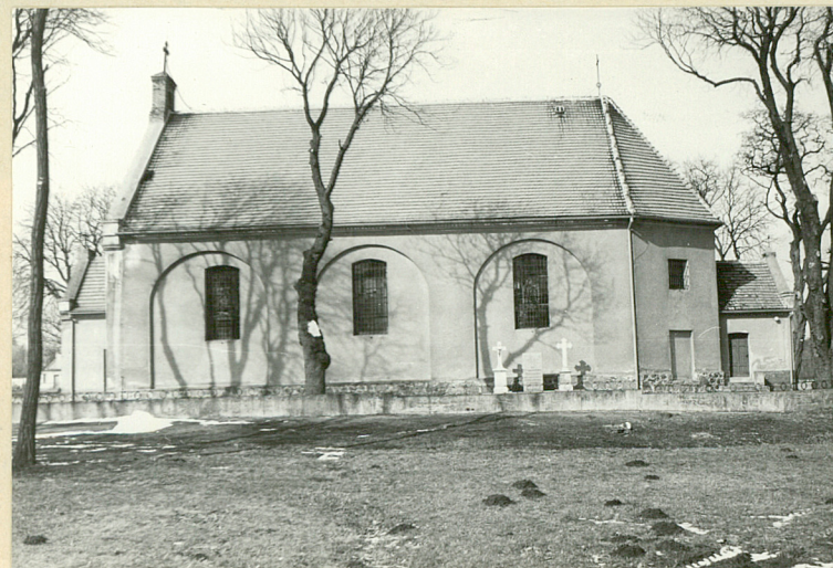
fot. 4 - elewacja pd.