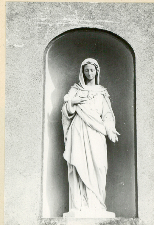
fot. 9 - nisza z figurą Matki Boskiej