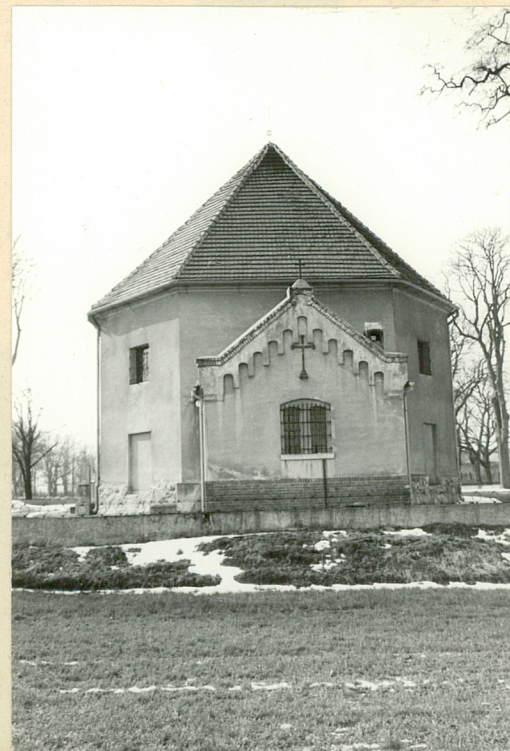
fot. 6 - widok od wsch.