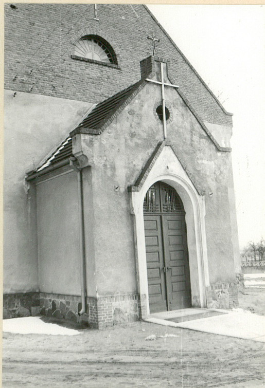
fot. 7 - kruchta, widok ogólny