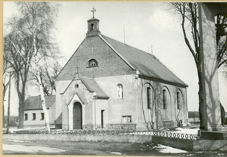
fot. 1 - widok ogólny od pd.-zach.