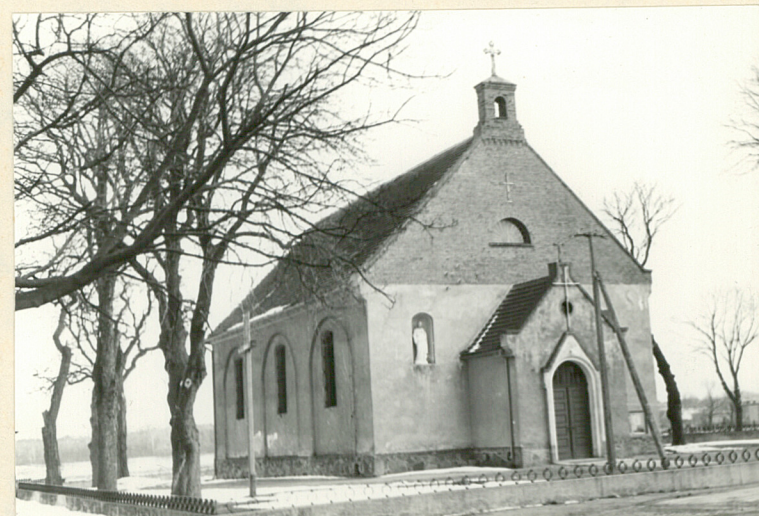
fot. 2 - widok ogólny od pn.-zach.