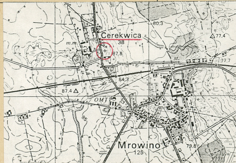
plan orientacyjny 1 : 25 000