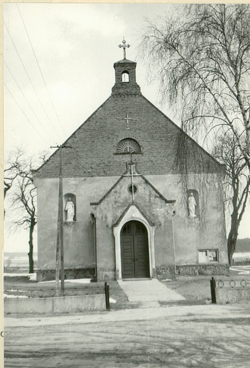
fot. 5 - widok od zach.