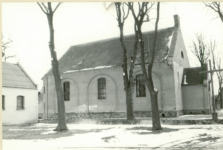
fot. 3 - elewacja pn.