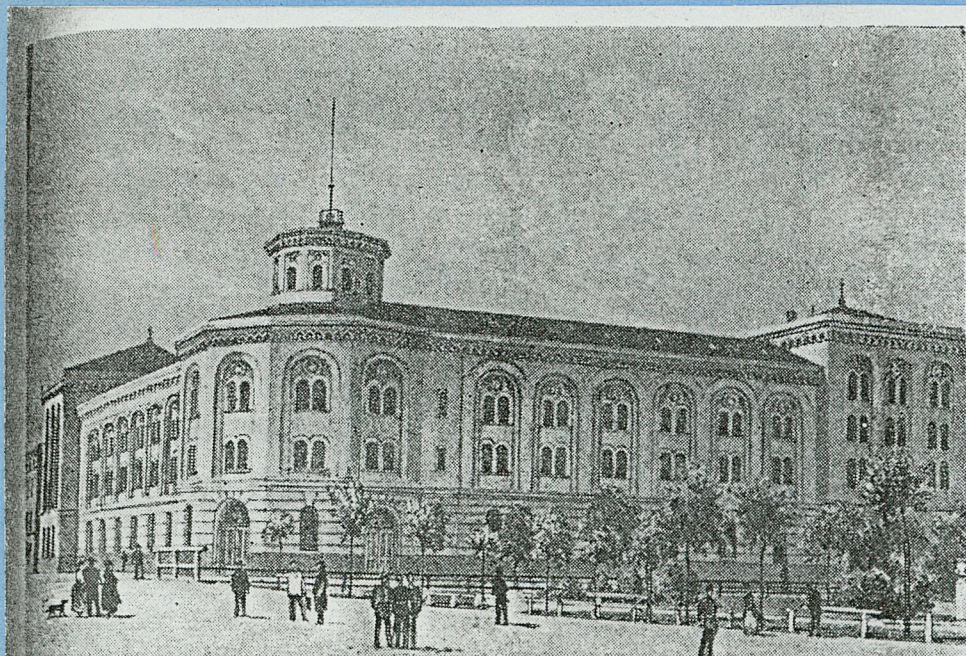
112. Arseniał artyleryjski na rogu Garbar i ul. Stawowej, 1868—1870. Litografia Roberta Geisslera, 1871

odbitki ksero - fragm. planu Poznania z 1871 r., litogr.