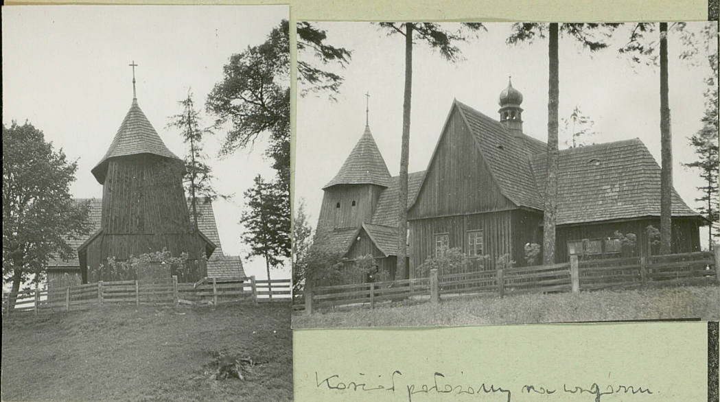
Kościół poświęcony św. Piotrowi.

Orientowany. Drewniany kościółek w stylu. Budowniczym zamknięte trójbocznie (pierwotnie świątynia prosta), przy nim od pn. zakrystia. Ściana nawa z dwoma kaplicami tworzącymi transept (dosłany 1911) - nieświeżka. Budowa od poł. Od zach. kwadratowa wieża kościelna. Wnętrze świątyni. W prezbiterium podwieszony wizerunek św. Marii - chór muzyczny wsparty na dwóch słupach należących do konstrukcji wieży. Na zewnętrznej ścianie malowane deshami. Dachy ciemne (na transepcie sygnale) z wieżyczką na sygnaturkę, kształt barokowy. Kiska wieża o ścianach pochylonych malowana deshami, biała ośmioramienna dachem namiotowym gontowym.