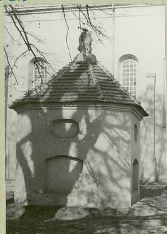
TZG Chelmno — Nr 495 9. 30 40.000 B-119479