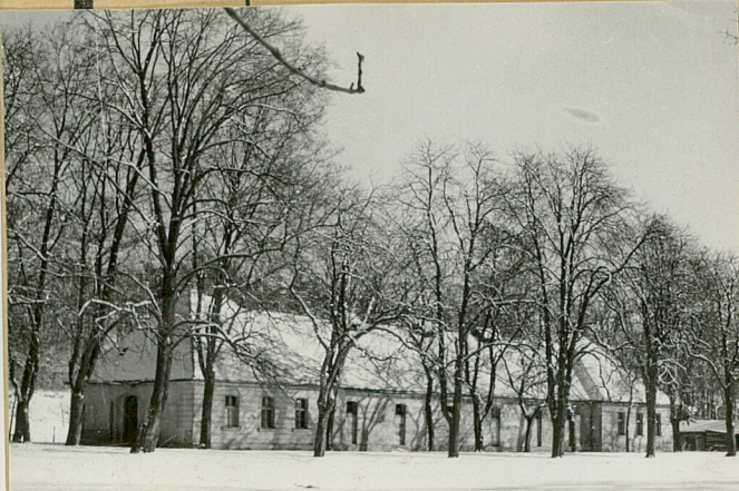
13. Vana v elvagi pld-ost.