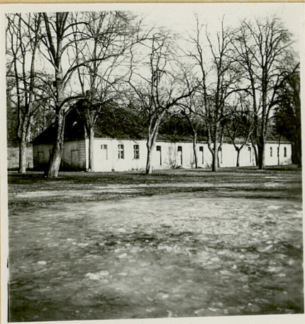
Widok od dziedzińca