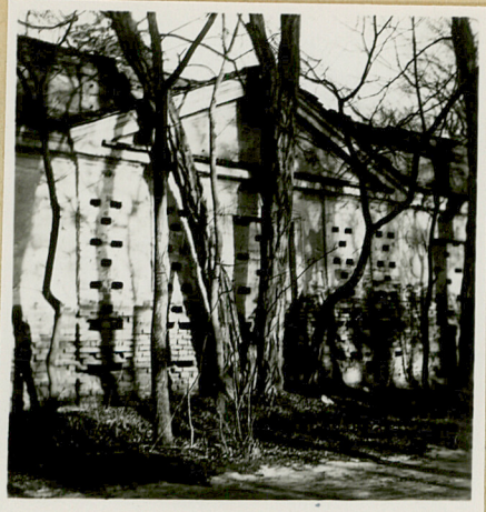
fragment elewacji frontowej

Usytuowana pomiędzy oficyną pałacową a d. stajnią po prawej stronie dziedzińca koprowego. Zachowane mury obwodowe ceglane, tynkowane rozetunkowane lizenami i gzymsem oddzielającym półpiętro środek elewacji fasadowej zaakcentowany przez niski trójkątny fronton ponad parę pilastrów. Pierwotnie dach drewniany, kryty stogiem.