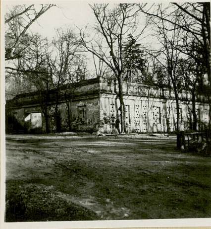
Widok od zew