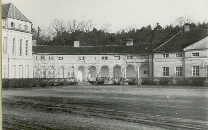
31. Szkic sytuacyjny, plan schematyczny, uwagi opisowe, fotografia