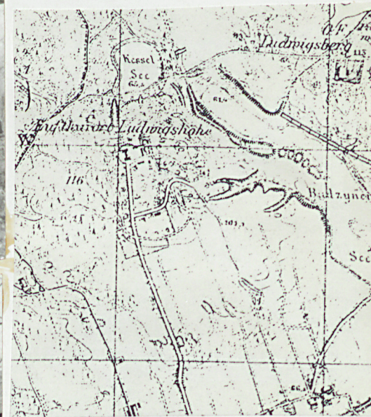
Wycinek mapy z ok. 1910 r. - powiększenie bez skali