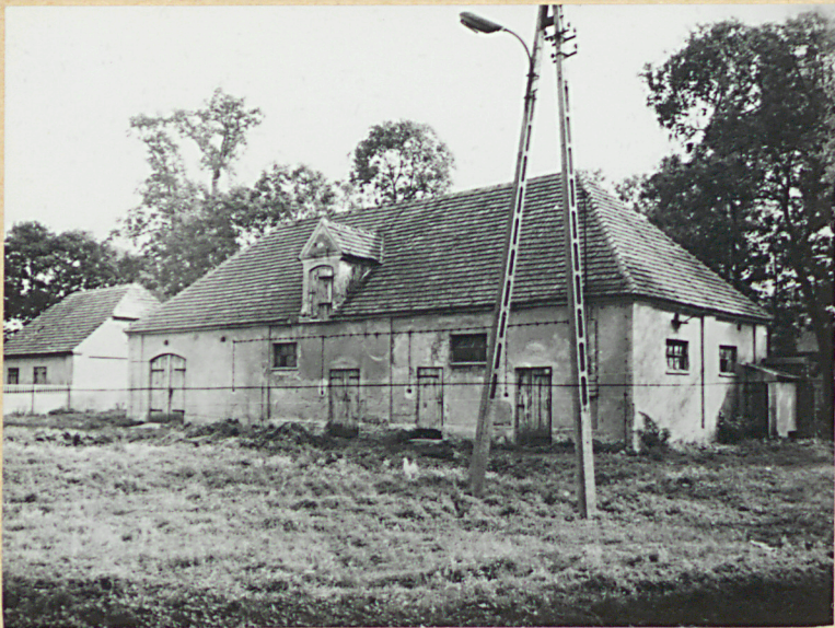
Widok z północnego zachodu

11. Zdjęcia, rzut, przekrój, sytuacja, orientacja