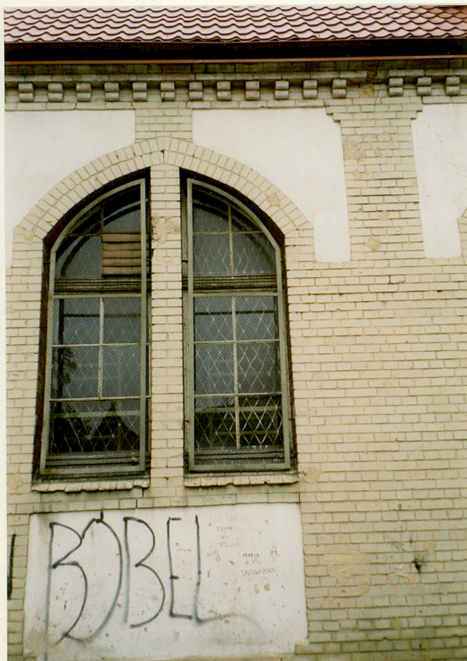
4 OKNO ELEWACJA PD.

3. Zawartość wkładki (nazwa obiektu i materiału uzupełniającego) fotografie, sytuacja, orientacja