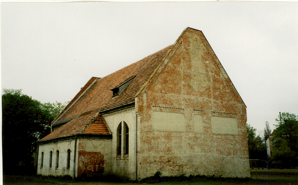
2. ELEWACJA PN.-ZACH.

z zastrzałami i parami "szyszek". W środku ściany pn. magazynki na sprzęt do ćwiczeń. wydzielone luksferami Wyposażenie: stolarki okienne z mosiężnymi klamkami w sali ćwiczeń. Instalacje: wod.-kan., c.o., elektryczna.