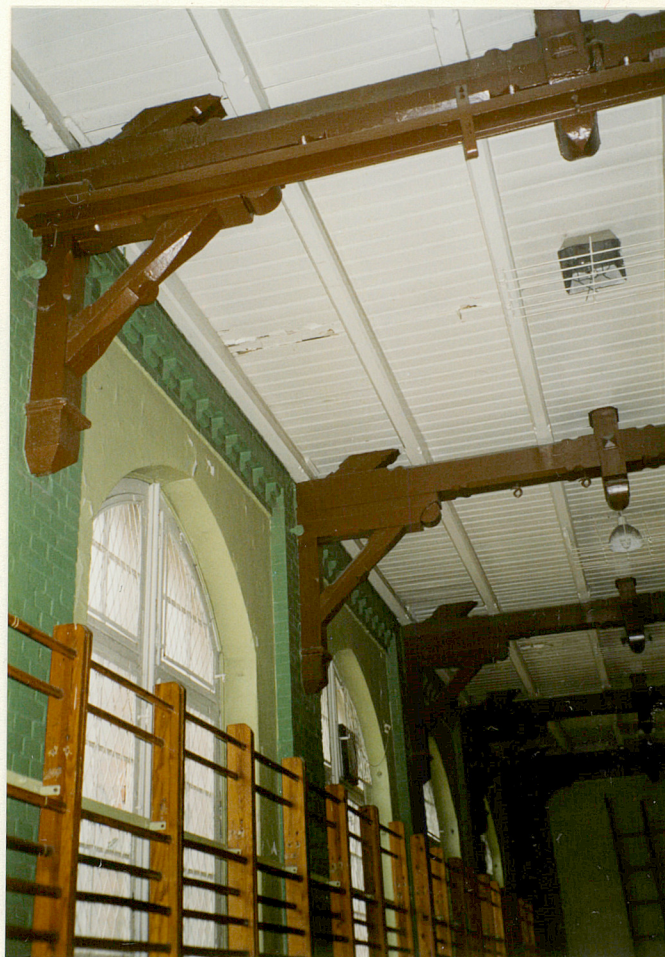
5. ŚCIANA PD.