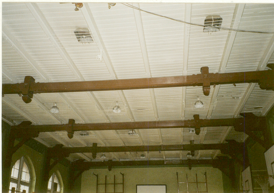
3. STROP - WIDOK OGÓLNY