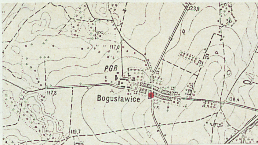
Mapa m. Bogusławice.