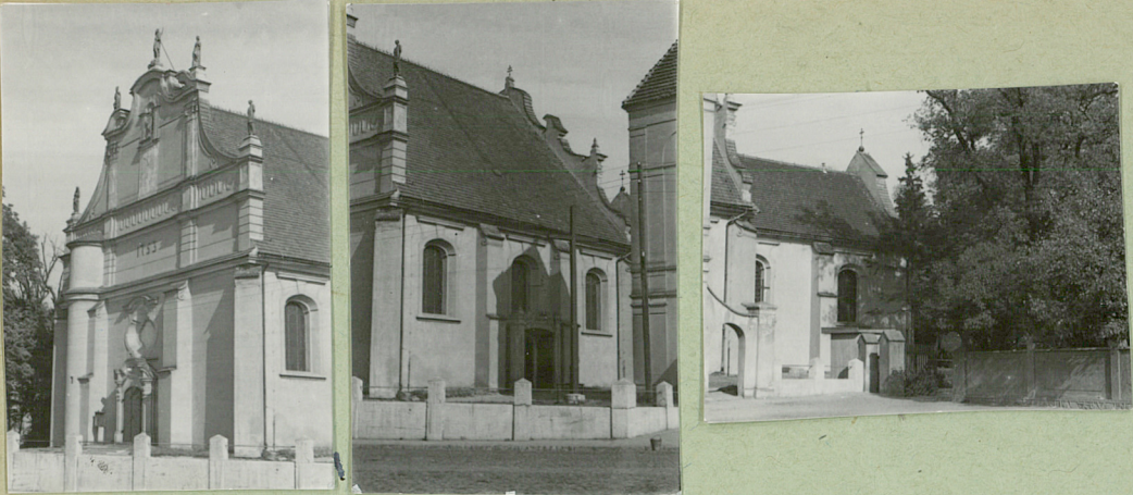
31. Szkic sytuacyjny, plan schematyczny, uwagi opisowe, fotografia