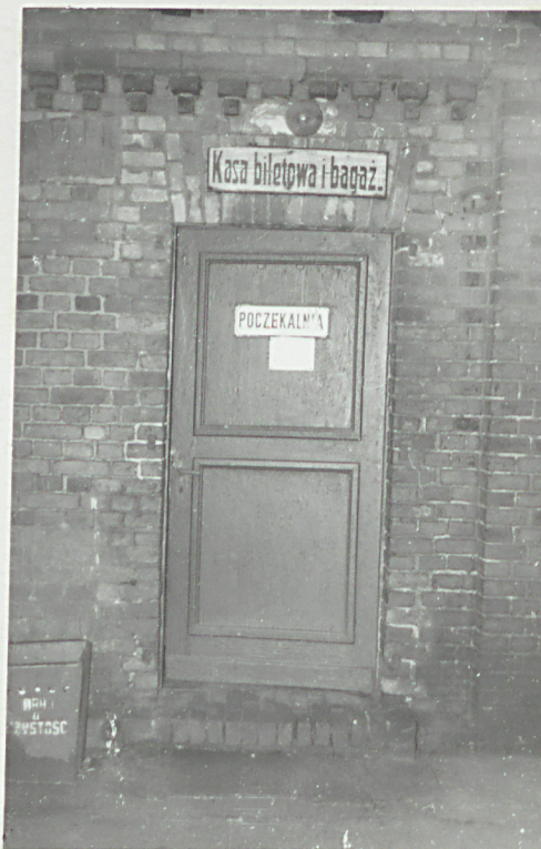
fot. 7 - drzwi do poczekalni