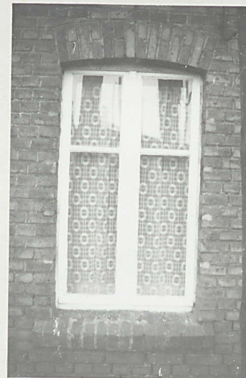
fot. 8 - okno