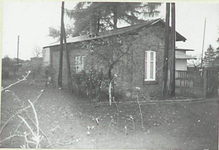
fot. 2 - widok od pd.