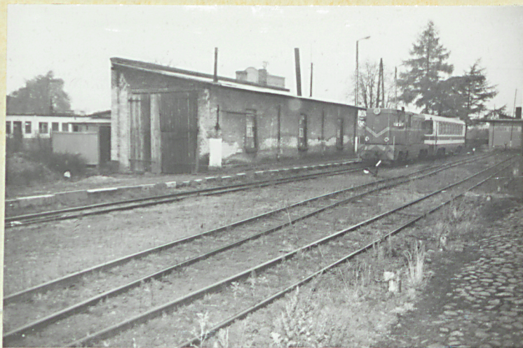
fot. 9 - parowozownia, widok od wsch.