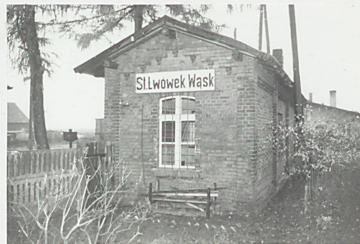
fot. 5 - elewacja pn.-zach.

Wkładkę założył: _____ (Imię, nazwisko, data)