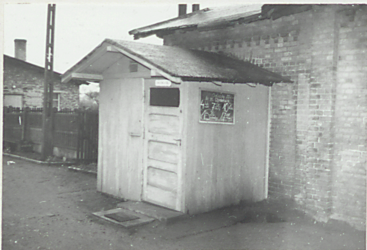
fot. 6 - ganek, w elewacji pn.-wsch.