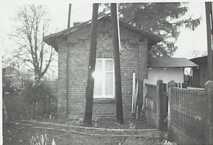
fot. 4 - elewacja pd.-wsch.

3. Zawartość wkładki (nazwa obiektu lub materiału uzupełniającego) fotografie