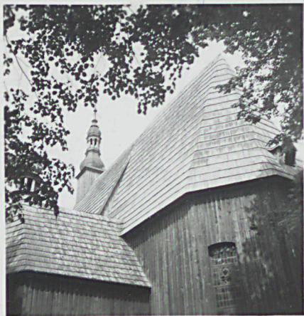
WIDOK od pd.wsch.