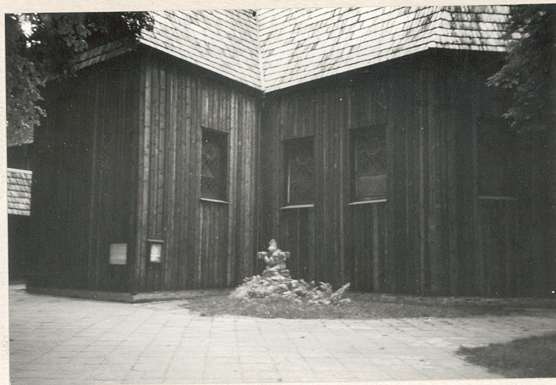
chór od str poł