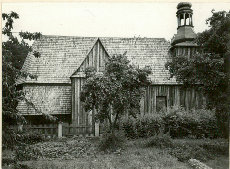
widok kościoła od pn