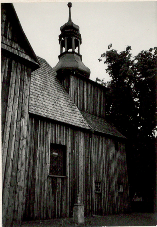
wieża od pn