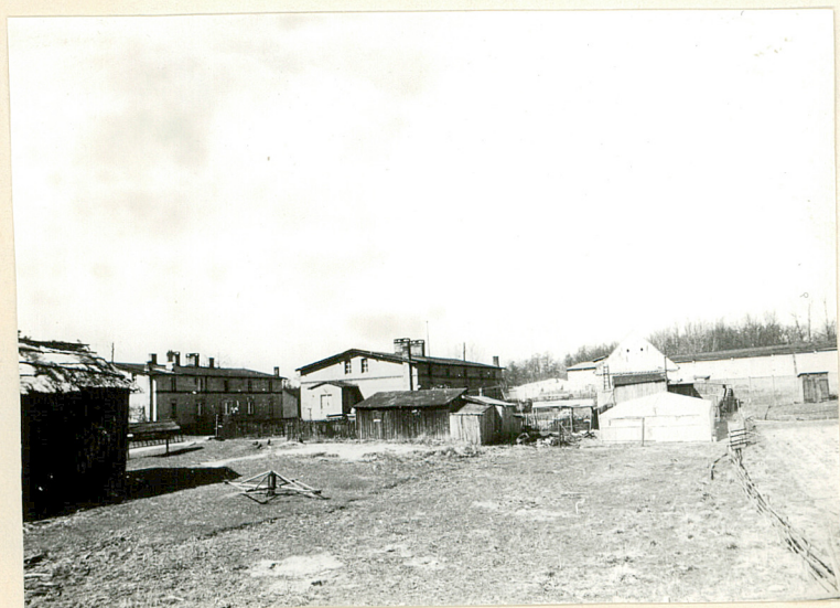
2. Budynek mieszkalny nr 23.