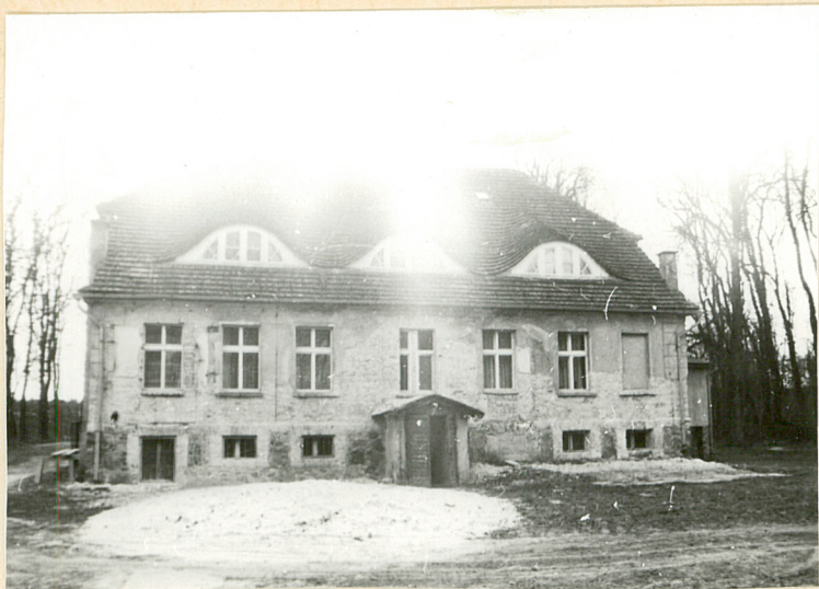
1. Elewacja północna pałacu.