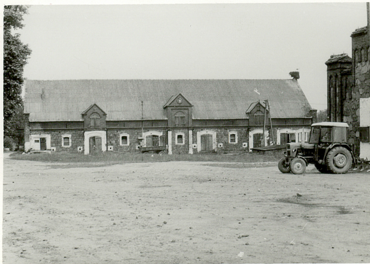
Fot.1. Elewacja południowa