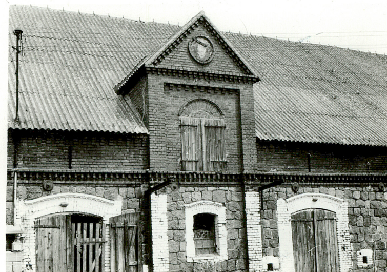
Fot.3. Ryzalit środkowy w elewacji frontowej