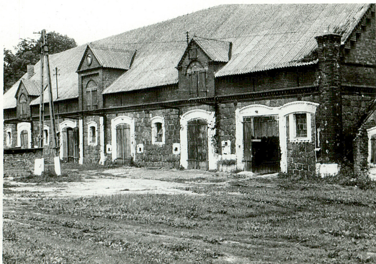
Fot.2. Widok od południowego wschodu