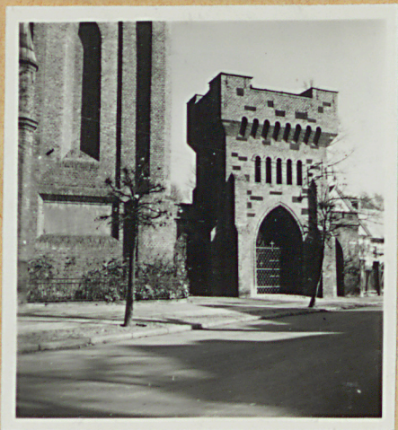
Drzonice po str. pn. FOT. E. KRYGIER Drzonice po str. poł.

Drzonice Murowane z cegły. Kształtowo symetryczne po bokach fasady, parady bramkami. Na murach prostokątów, z ostrołukowymi przejazdami bramowymi, z parami ostro- łukowymi i pseudomedykami z murkami. Por- ty i miedziastwo jest okryte blachą. Bramki bo- we ostrołukowe, murowane kwaterkami. Mur ogrodzenia od poł. i poł. z cegły białostockiej.