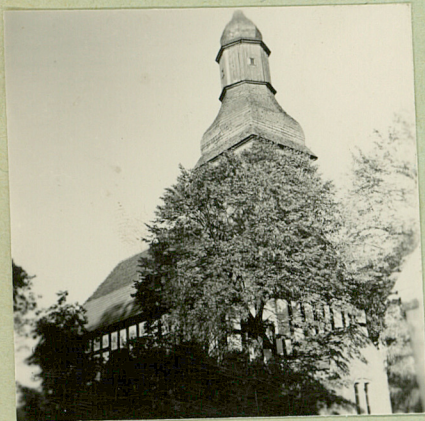
stan z 1964r.

Ryglowy wypełniany cegłą, salowy. Od wsch. zamknięty trzema ścianami ośmioboku, od zach. wciągnięta w nawę wieża z barokowym hełmem, pobitym gontem. Bibliografia: F. Mamuszka, J. Stankiewicz = Wykaz zabytków powiatu złotowskiego /maszynpp.1958/.