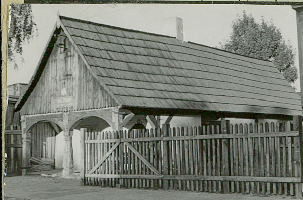
Wagi opisowe, fotografia

Z Y X W V U T S R P O N M L K J I H G F E D C B A Nr