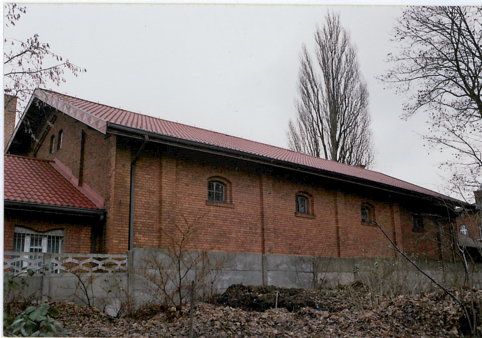
18. Łącznik między starą i nową halą sportową – widok od południa, fot. 283/7/6