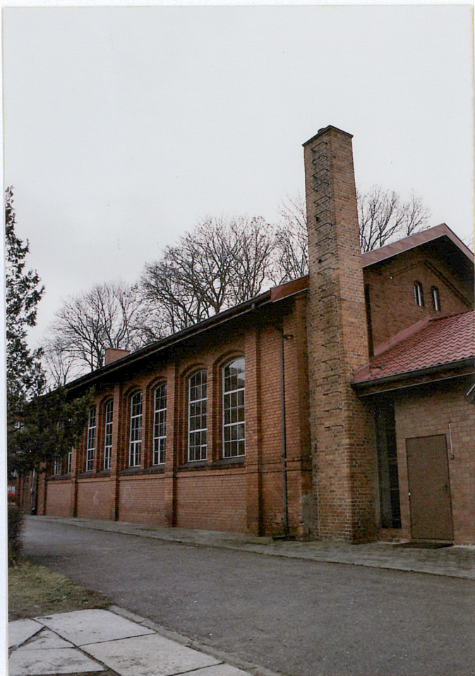
16. Hala sportowa z 1903 r., elewacja północna, fot. 284/4/2