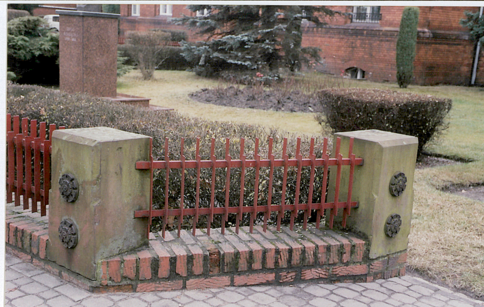
33. Żeliwne rozety na słupkach ogrodzenia, fot. 285/3