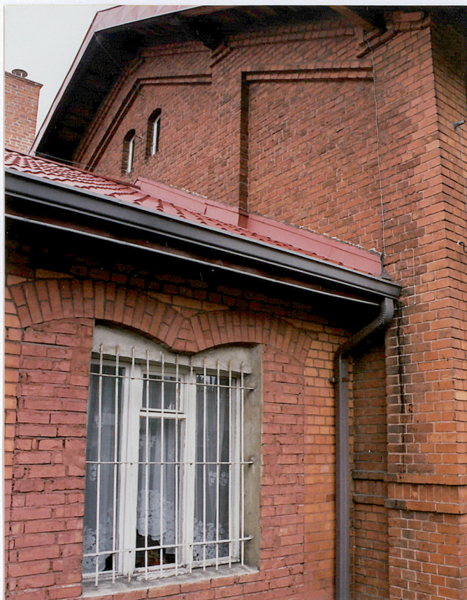
19. Szczyt zachodni i detal łącznika hali z 1903 r., fot. 284/1/2