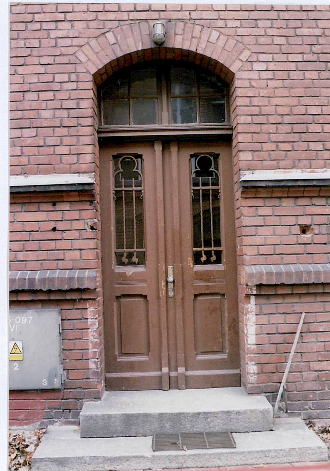
12. Drzwi wejściowe w elewacji północnej, fot. 284/3/2