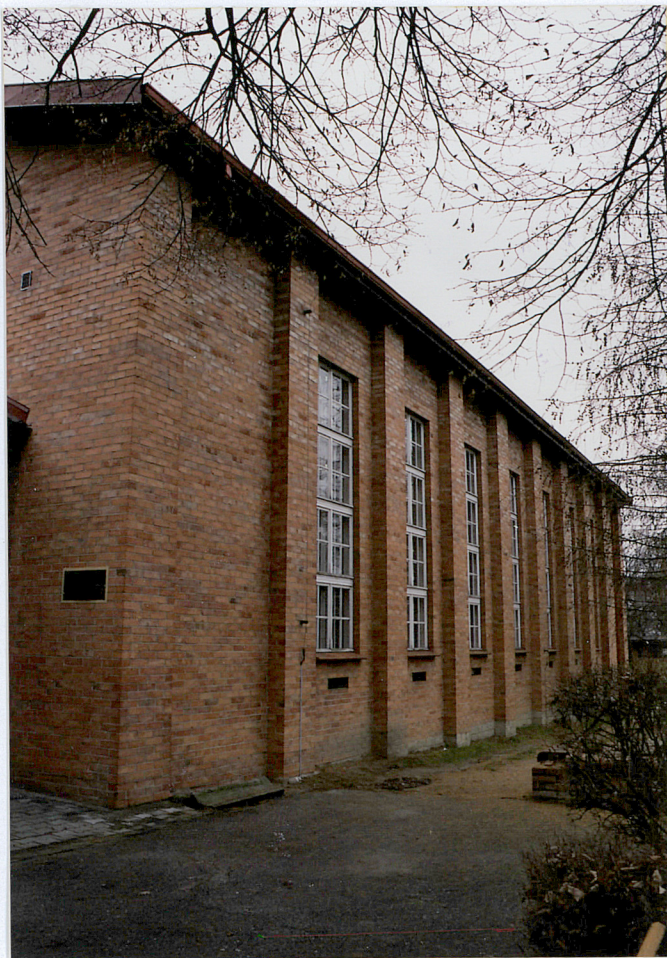
22. Nowa hala sportowa – elewacja północna, fot. 284/4/4