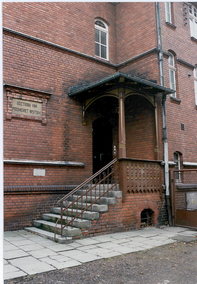
11. Ganek wejścia głównego, fot. 284/3/1