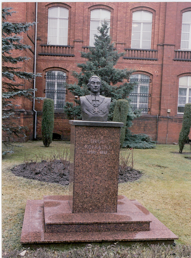
31. Pomnik patrona szkoły na skwerze przy ul. Kołłątaja, fot. 283/6/4