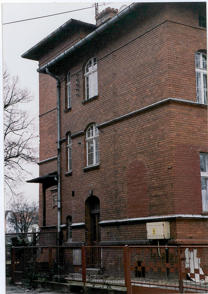
10. Budynek mieszkalny – elewacja północna, fot. 284/3/5