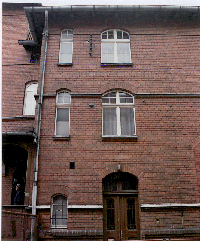
13. Budynek mieszkalny, elewacja północna – pion klatki schodowej i pomieszczeń sanitarnych, fot. 284/6/6