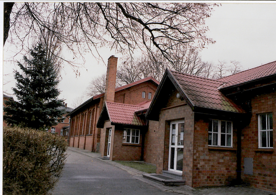
21. Łącznik starej i nowej hali sportowej, fot. 284/4/1