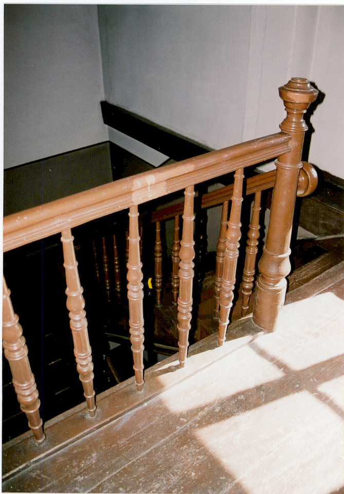
Stolarka klatki schodowej.