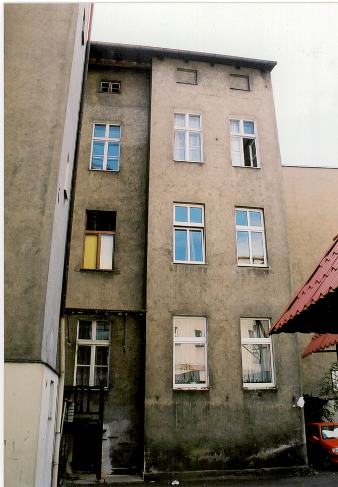
Elewacja wschodnia oficyny