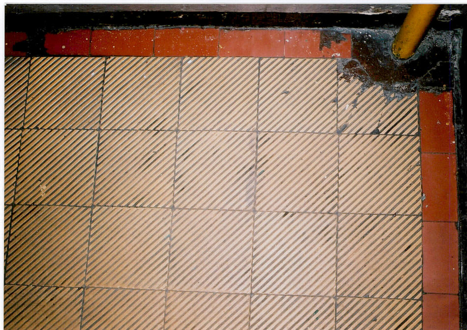
Ceramiczna posadzka – parter - klatka schodowa.