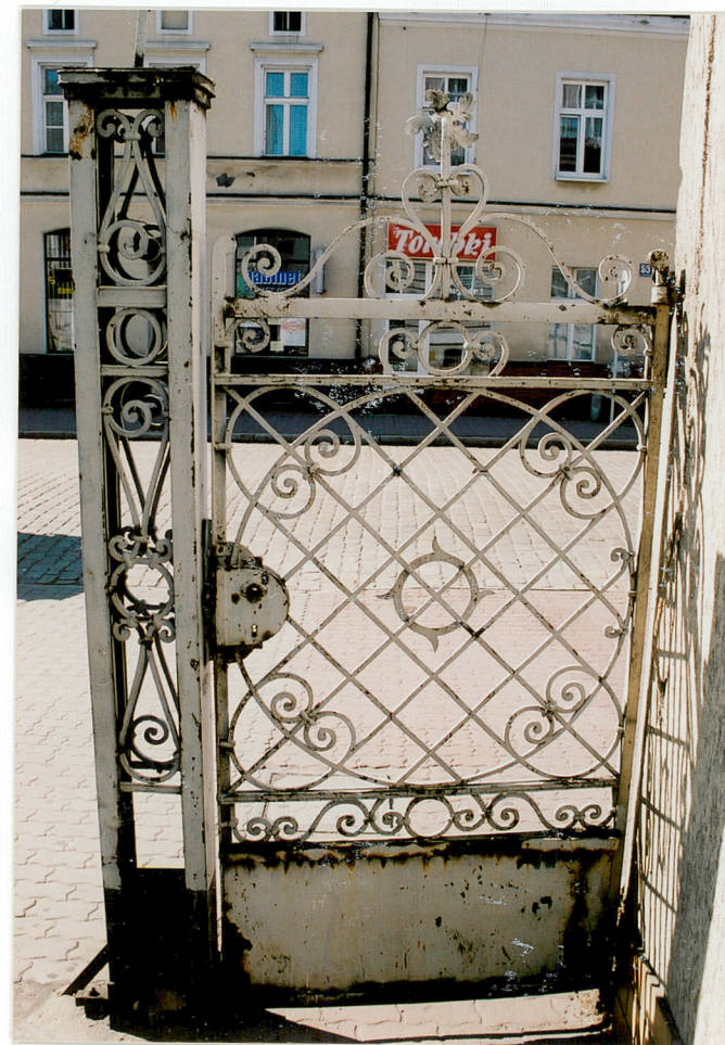
Brama wjazdowa na teren posesji (jedno ze skrzydeł) oraz furta.