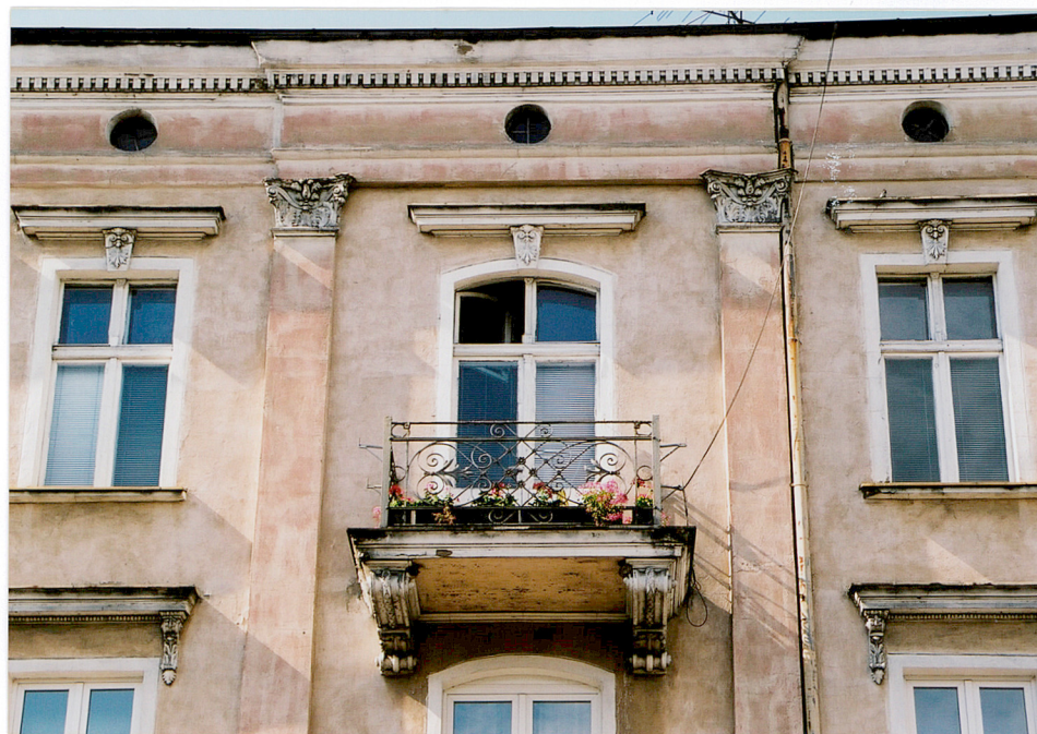
Elewacja południowa (frontowa) – detale architektoniczne trzeciej kondygnacji