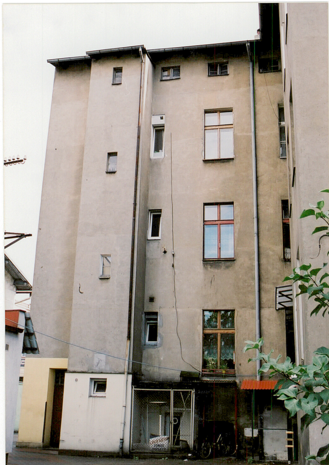
Elewacja północna domu – tylna