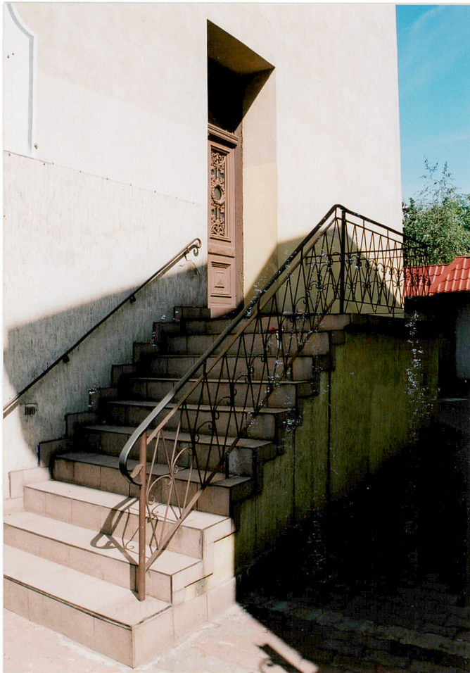
Schody przy elewacji wschodniej