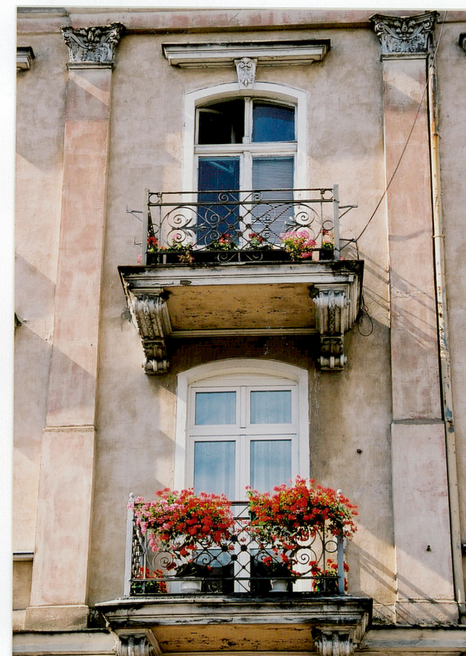
Elewacja południowa (frontowa) – detale architektoniczne

Wkładkę założyła Justyna Pawłowicz, 2003 r.