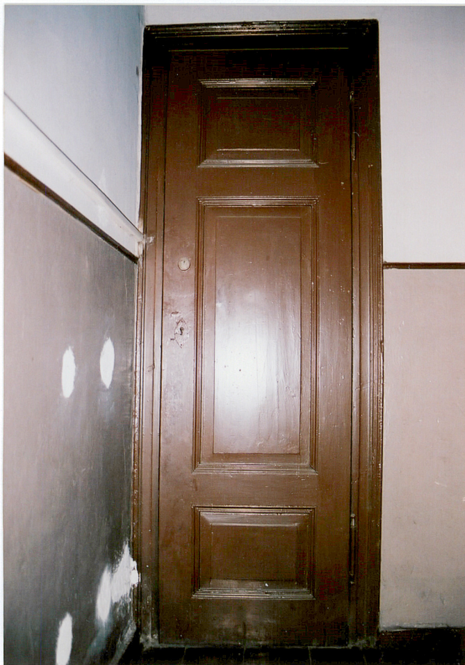
Stolarka drzwi do schowka na klatce schodowej.