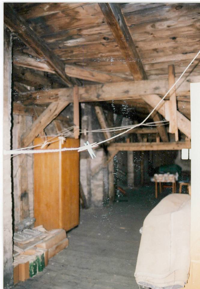
Poddasze – więźba dachowa.