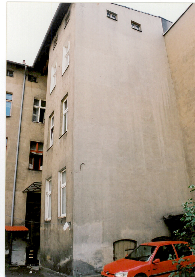
Elewacja północna oficyny