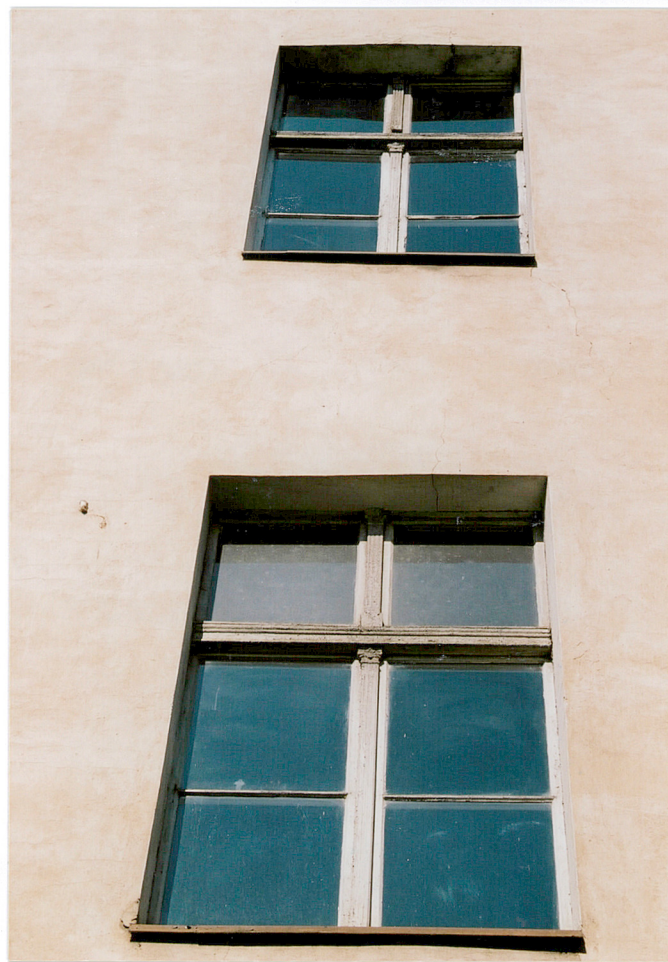
Elewacja szczytowa (wschodnia) – stolarka okienna