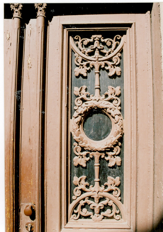
Elewacja wschodnia (szczytowa) – stolarka drzwi wejściowych

Wkładkę założyła Justyna Pawłowicz, 2003 r.