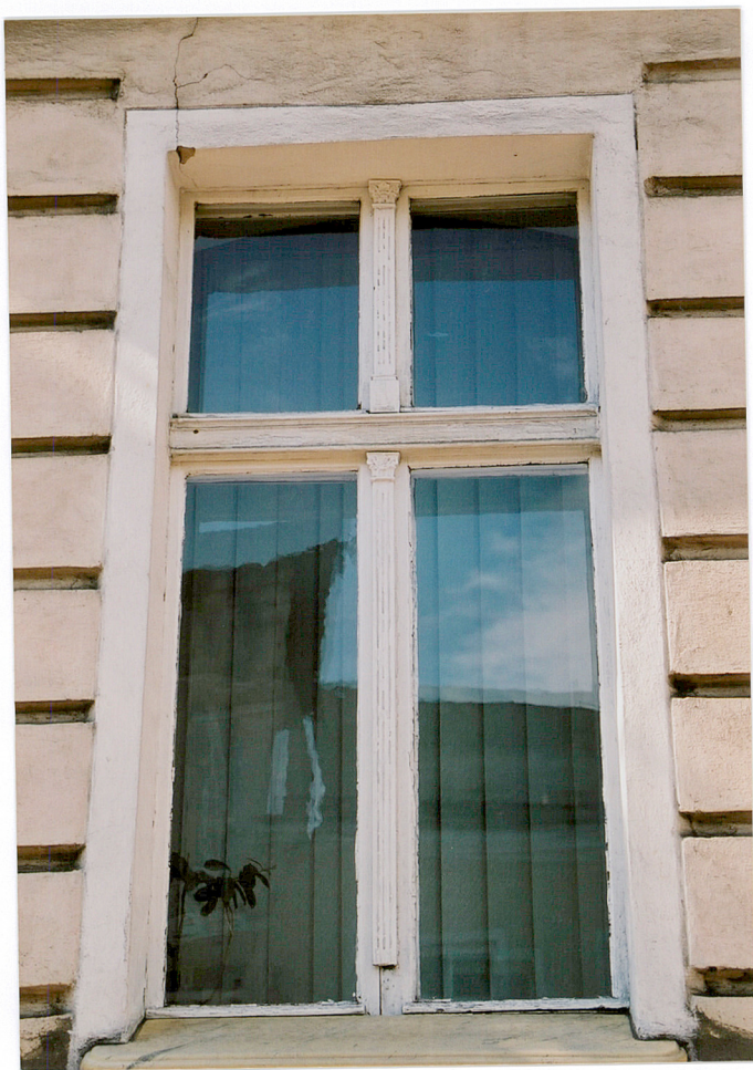
Elewacja frontowa – oryginalna stolarka okienna