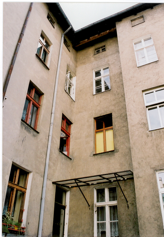
Elewacja północna domu (tylna) w miejscu styku głównego budynku z oficyną