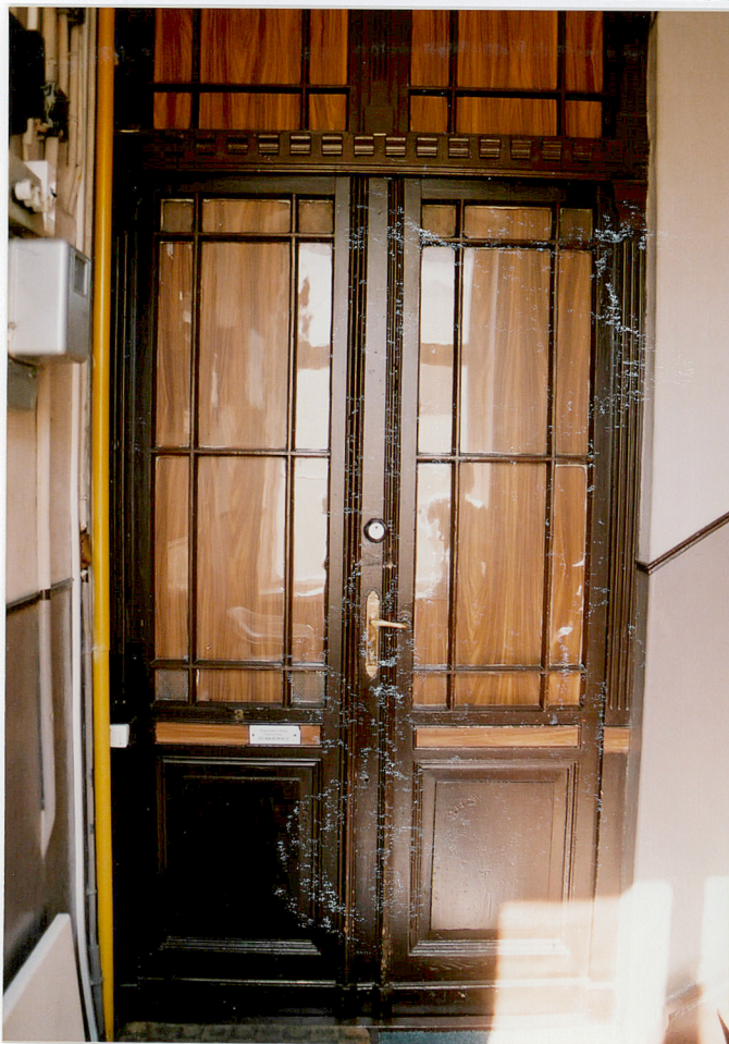
Stolarka drzwi wejściowych do mieszkań.