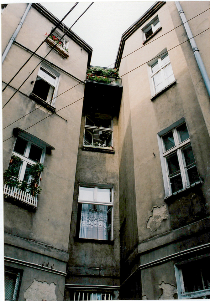
Elewacja tylna budynku głównego na styku z oficyną wschodnią (4), elewacja zachodnia oficyny wschodniej (5, 6).