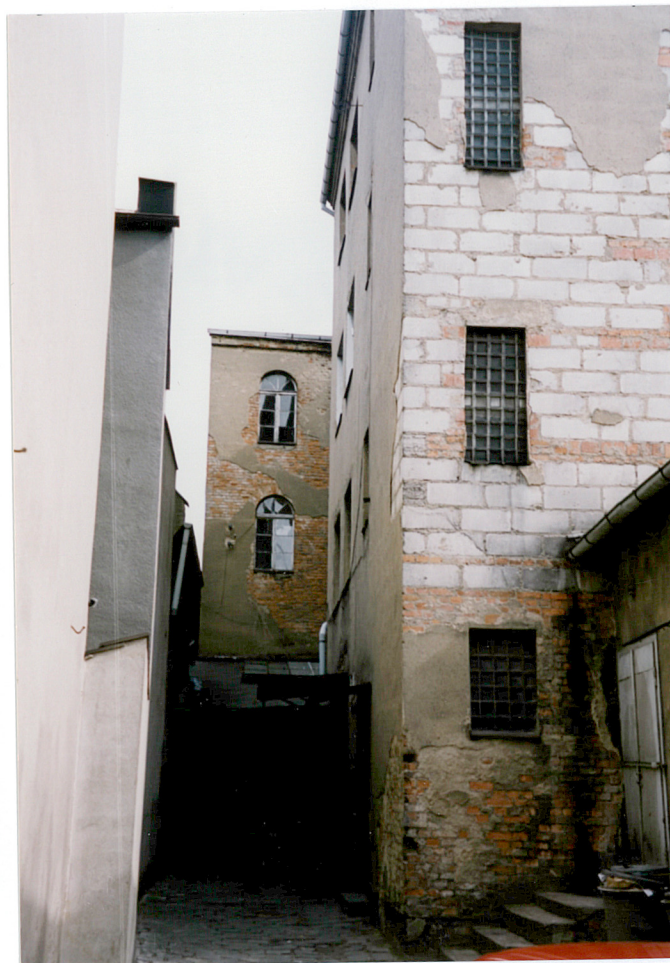
10. magazyn piekarni, budynek w podwórzu i fragment budynku front.