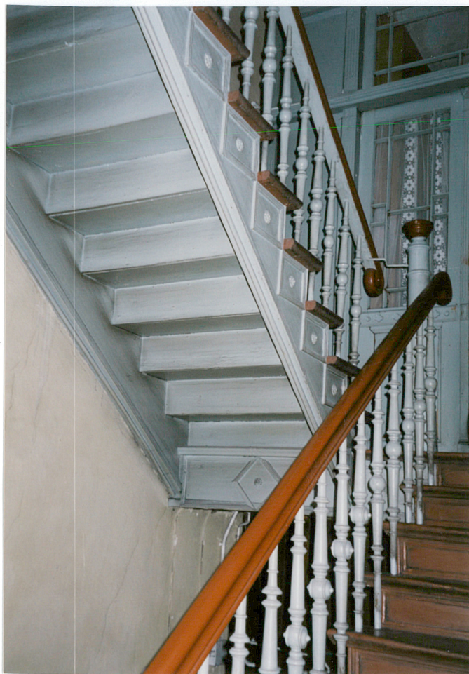
12. klatka schodowa między II a III kondygnacją