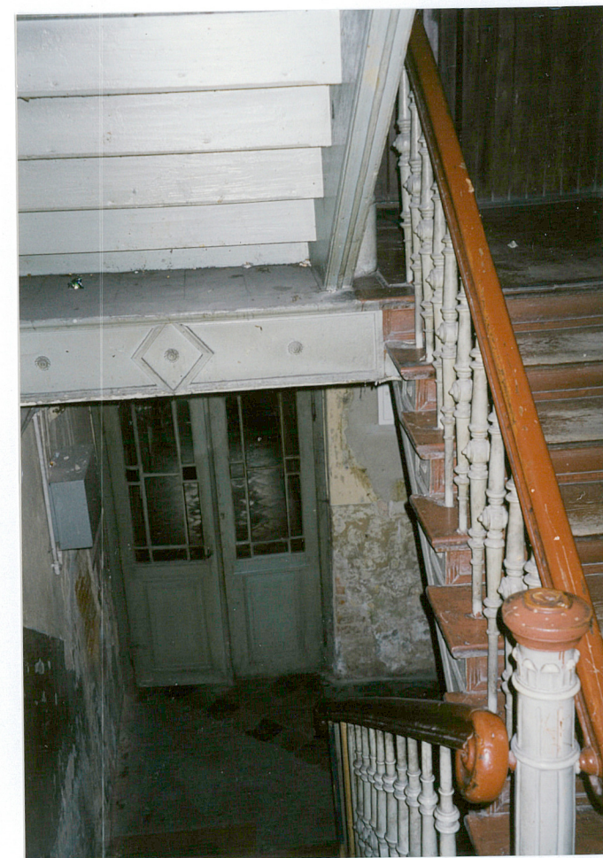
11. klatka schodowa z I kondygnacji na II kondygnację