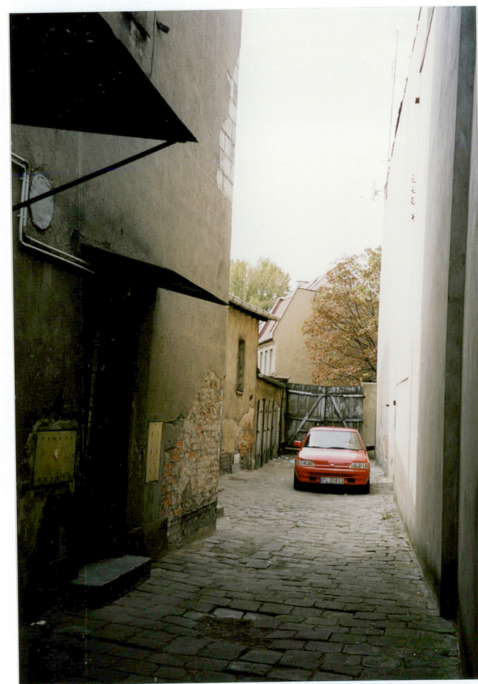
8. widok na podwórze z bramą od strony wschodniej