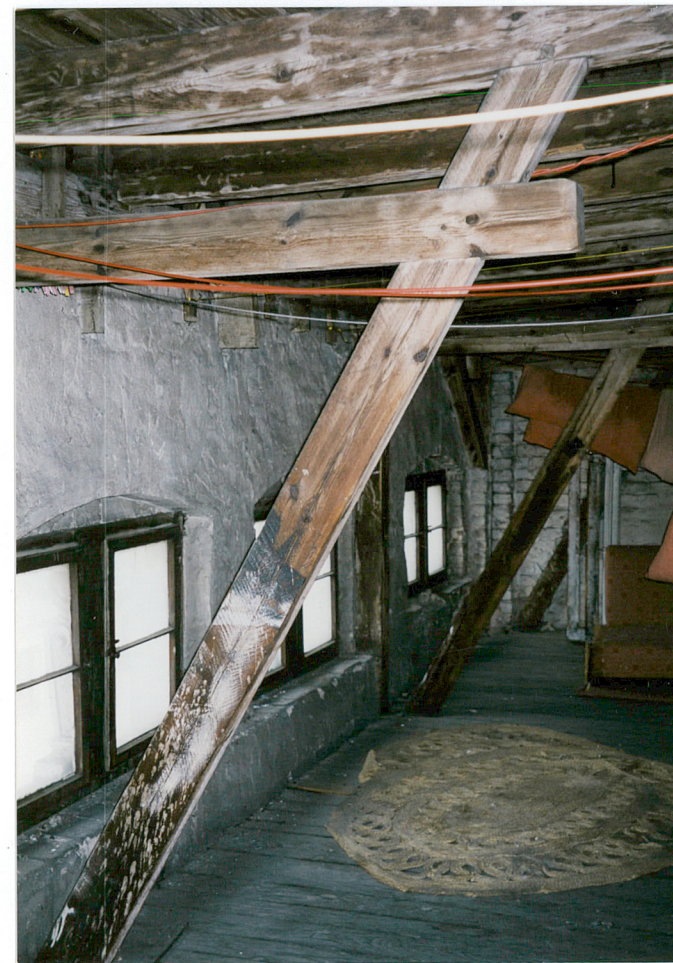
14. fragment więźby dachowej budynku frontowego ze ścianką kolankową i zastrzałami.