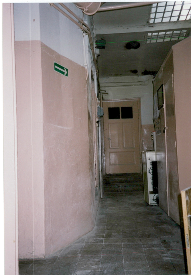
24. wnętrze piekarni z korytarzem wzdłuż pieca piekarniczego i drzwiami do piekarni