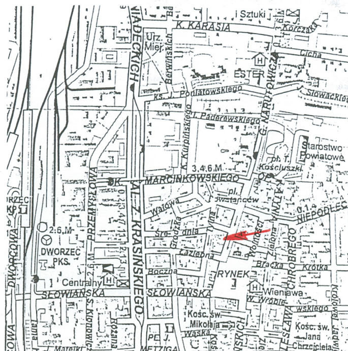
2. plan orientacyjny