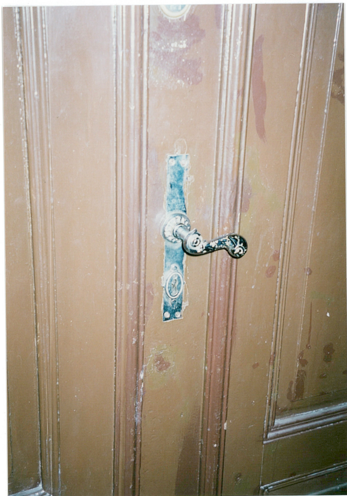
26. klamka w drzwiach wejściowych mieszkania 1 na II kondygnacji