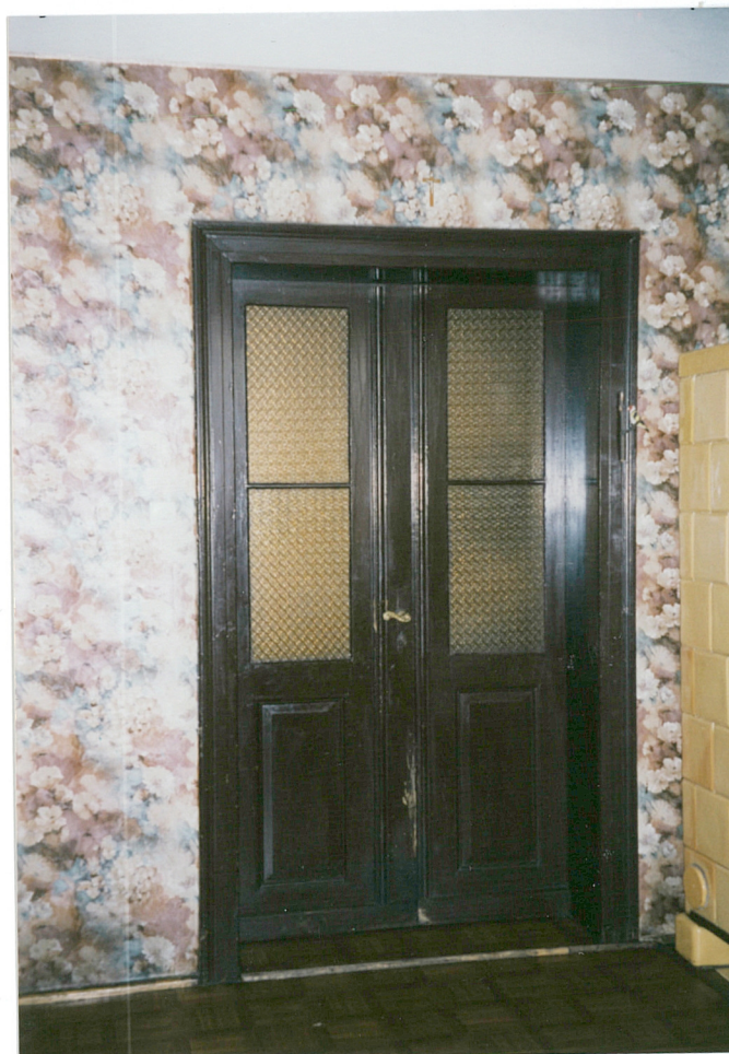
21. drzwi w salonie mieszkania [redacted]