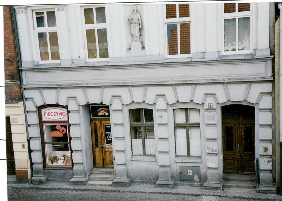
5. I kondygnacja fasady