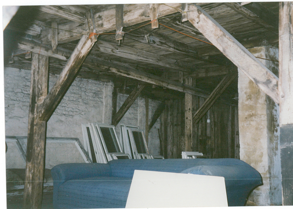
16. wnętrze strychu