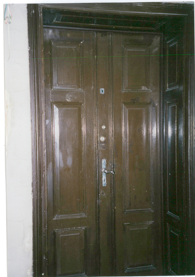
19. drzwi do mieszkania na II kondygnacji