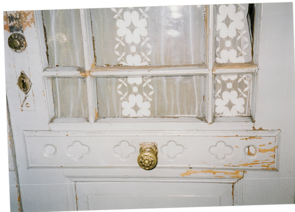
27. gałki i zamek w drzwiach wejściowych do mieszkania [REDACTED]