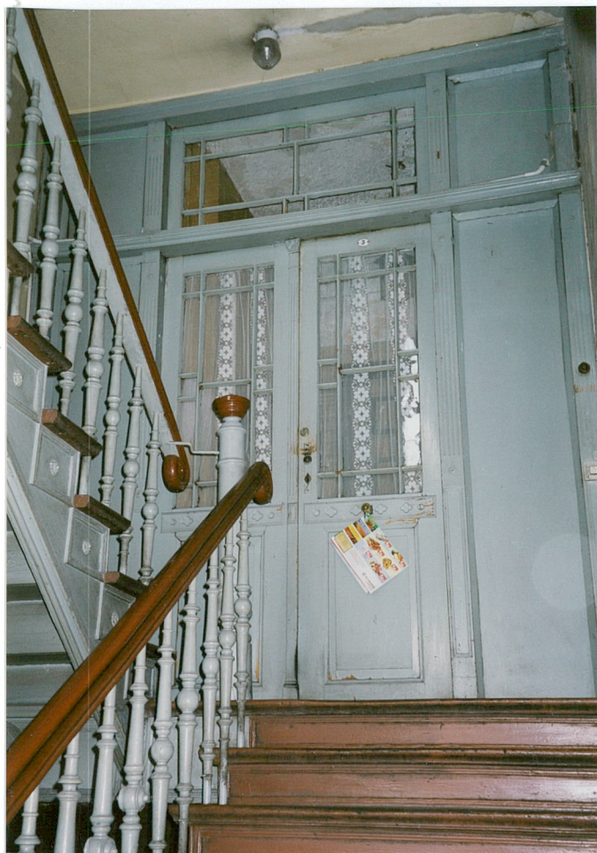
20. drewniana ściana z drzwiami w III kondygnacji (mieszkanie [redacted])