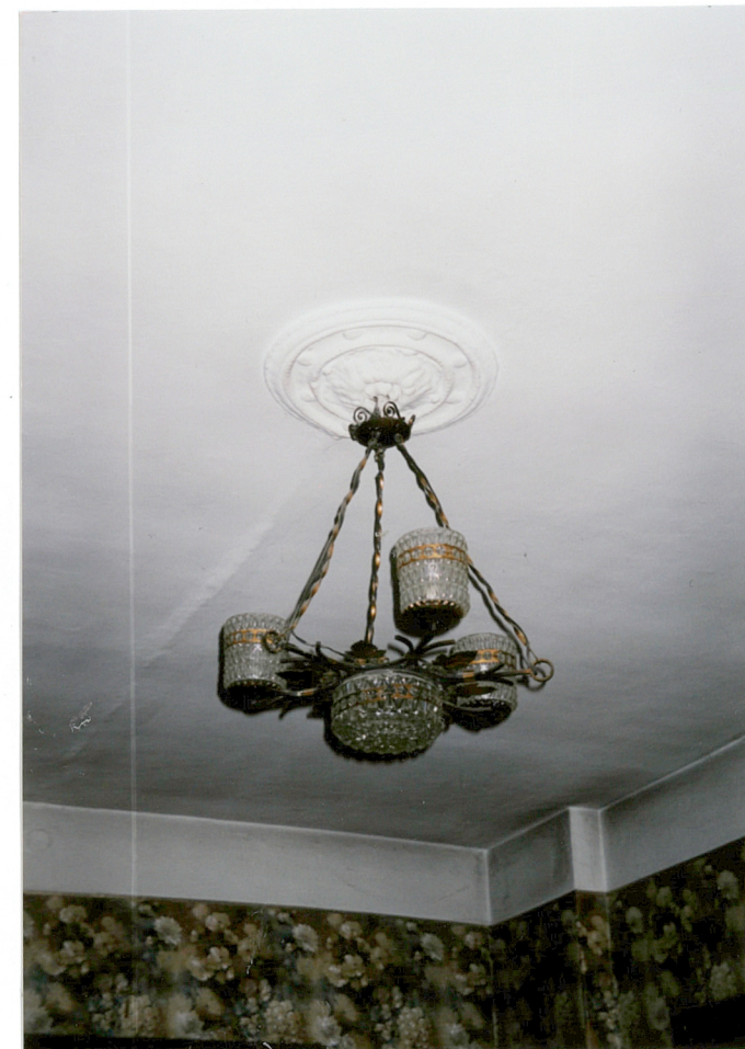
25. plafon w salonie mieszkania [REDACTED]