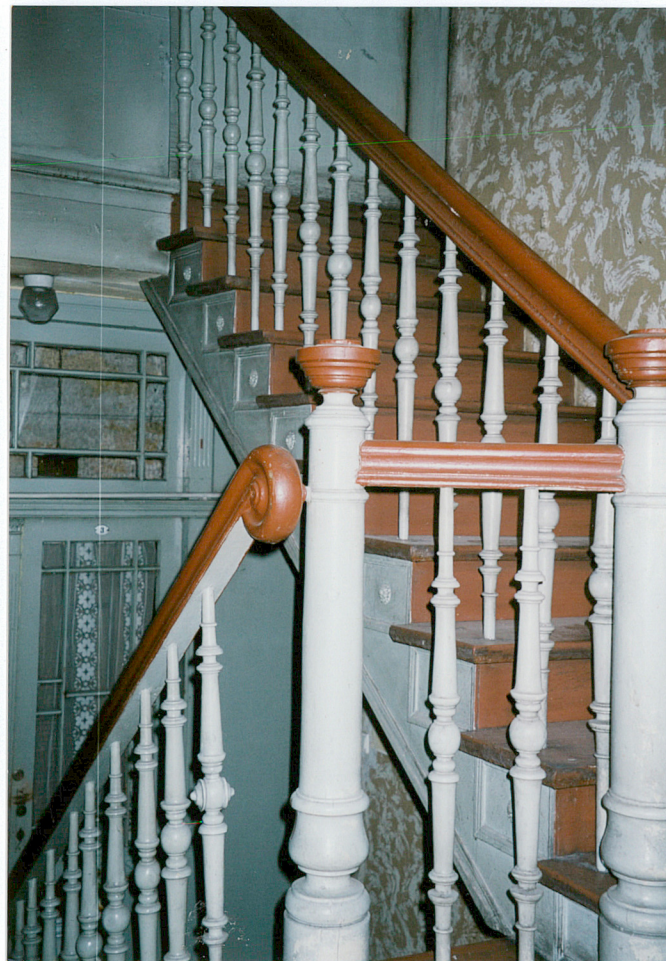
13. klatka schodowa między III kondygnacją a poddaszem.