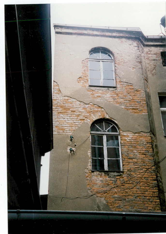
22. okna klatki schodowej widziane od podwórza