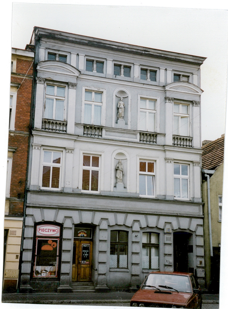
1. widok ogólny