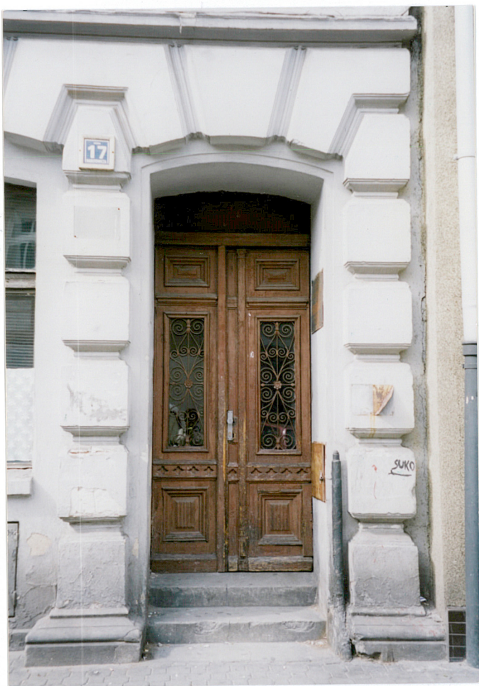
17. północne drzwi wejściowe do budynku frontowego