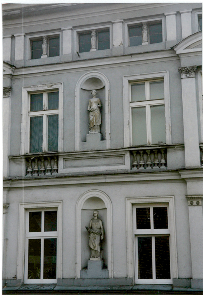
6. środkowa część fasady w II i III kondygnacji z oknami strychowymi