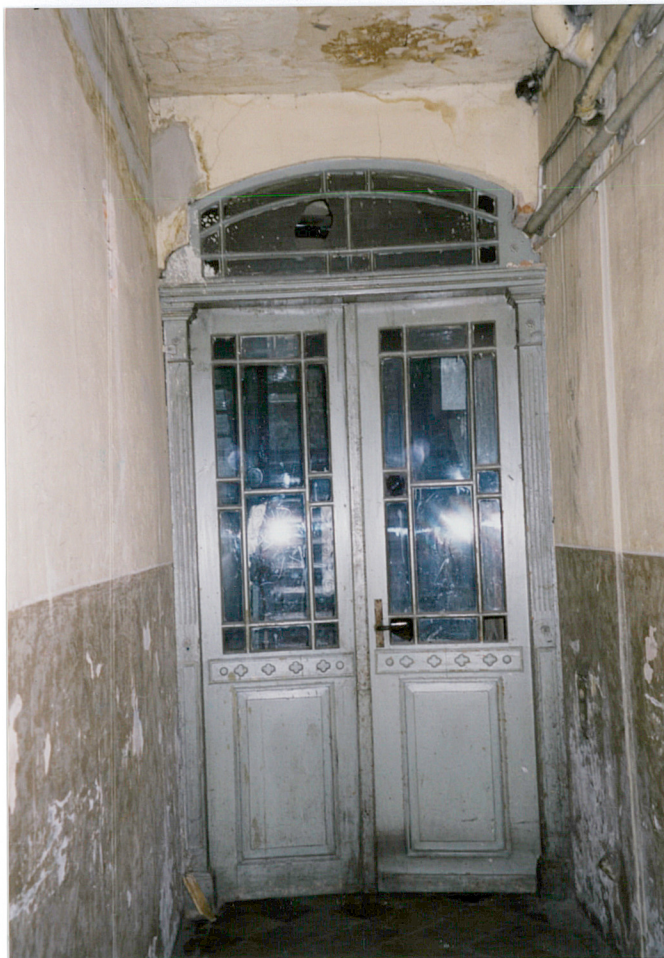
18. drzwi z sieni na klatkę schodową