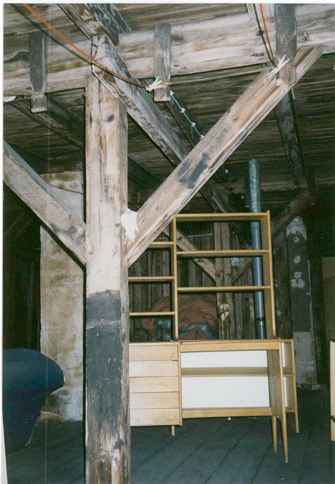
15. stolec więzby dachowej