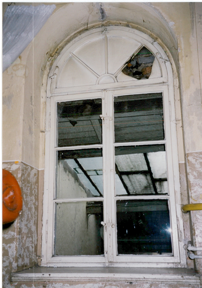
23. okno na półpiętrze klatki schodowej