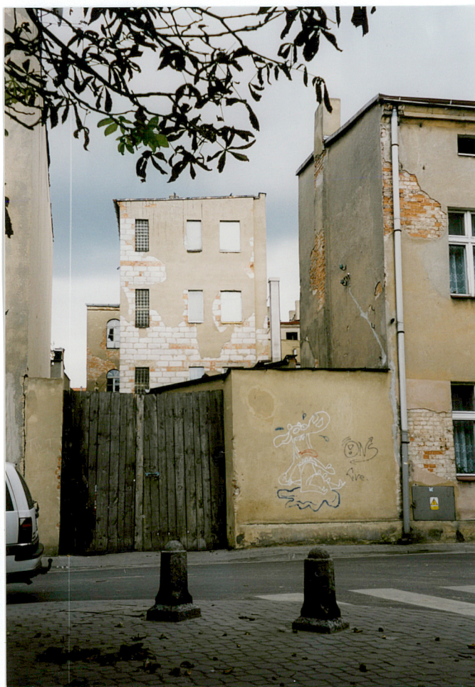
7. brama posesji od ul. Tylnej