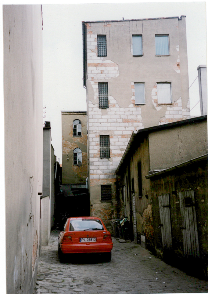
9. podwórze i posesja widziane od bramy