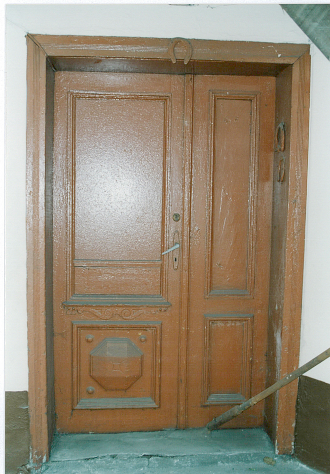
9. Drzwi do przybudówki w oficynie północnej