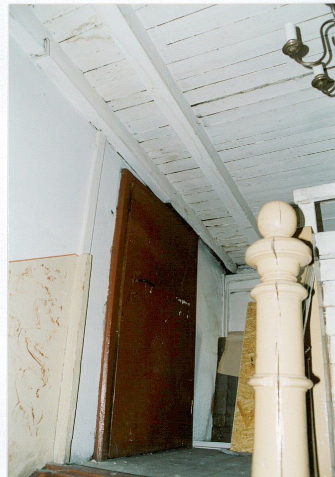
10. Oficyna południowa - poddasze (widoczne ślady zawilgocień)