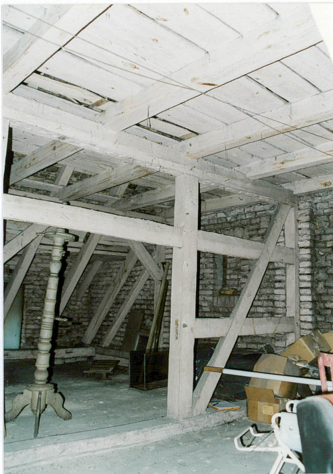
14. Fragment więźby dachowej