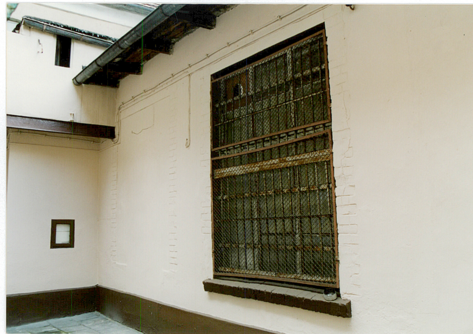
2. Oficyna północna – okno dawnego warsztatu