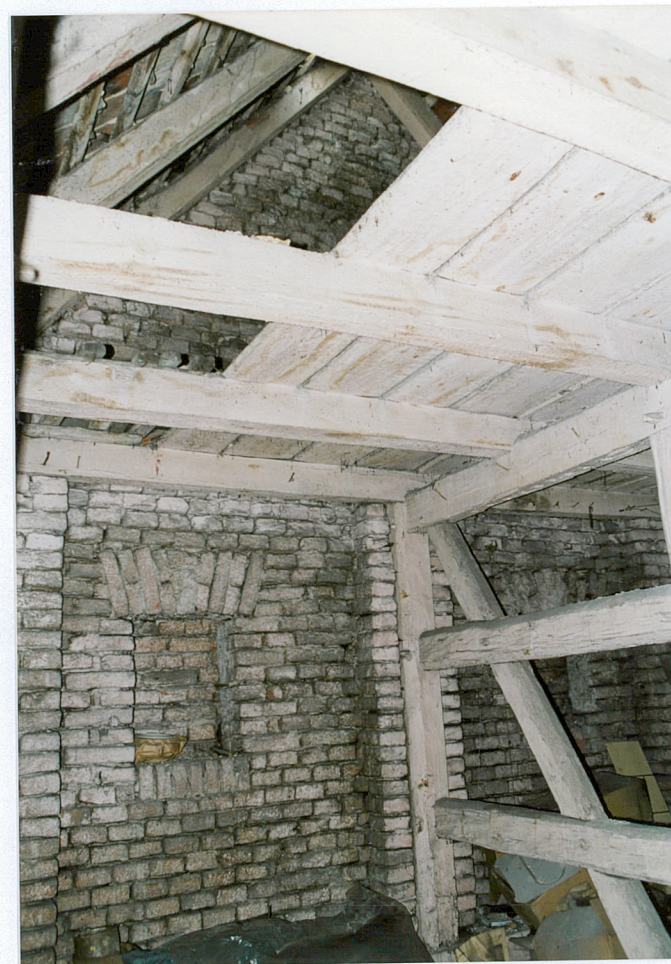
15. Fragment więźby dachowej