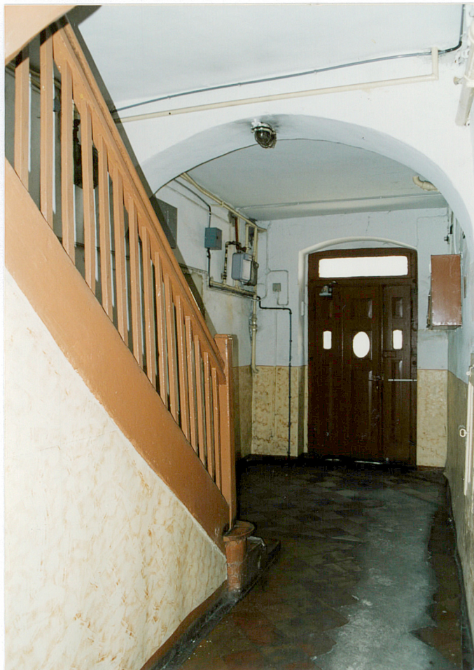
11. Sień – widok w kierunku zachodnim