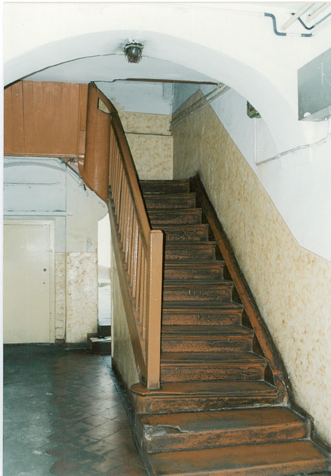
12. Sień – widok w kierunku wschodnim