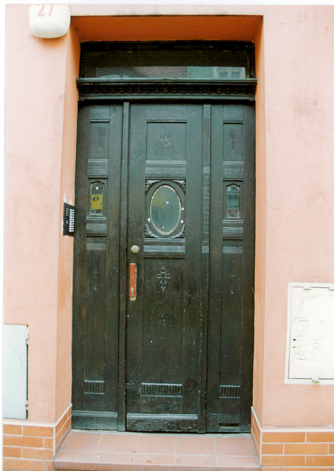
8. Drzwi zewnętrzne wejściowe