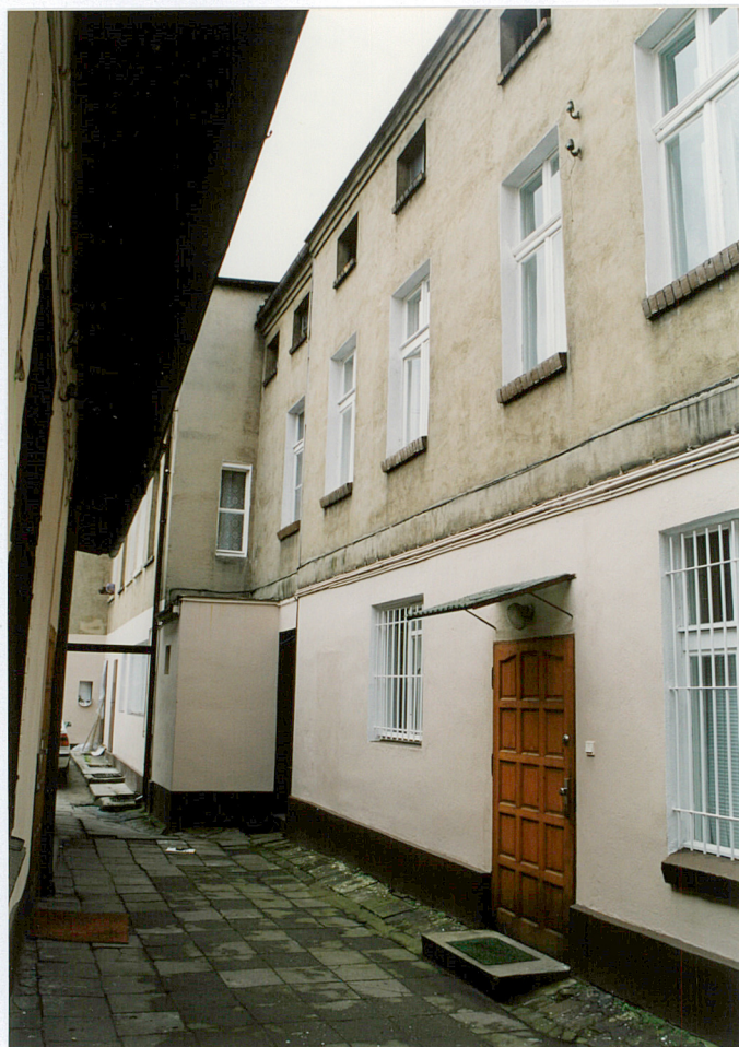
5. Oficyna południowa