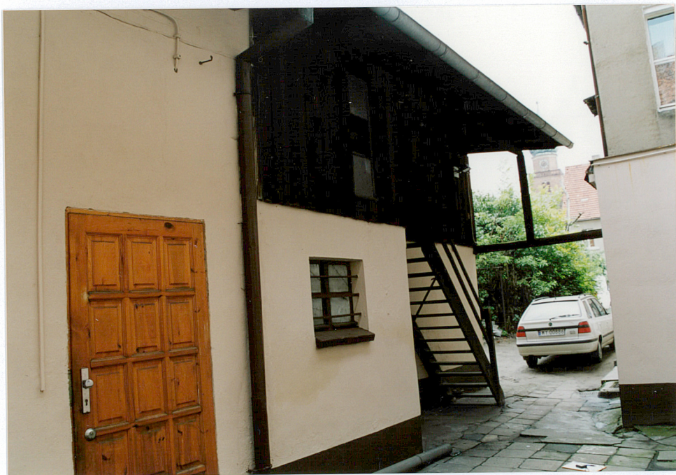
3. Oficyna północna – widok na przybudówkę