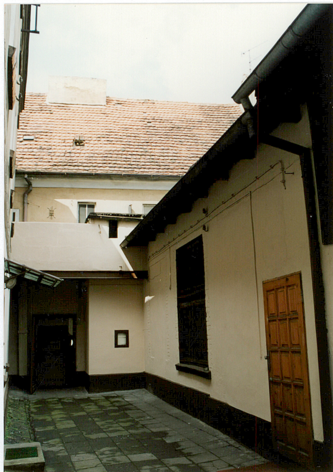
1. Widok na budynek od strony wschodniej

19. Zawartość wkładki (nazwa materiału uzupełniającego) Zdjęcia