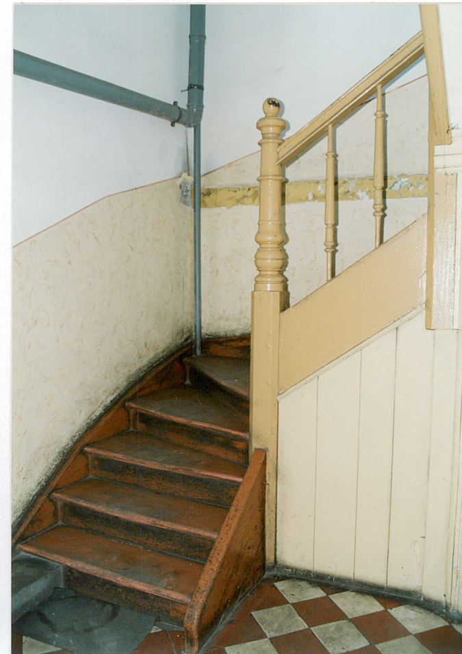
13. Klatka schodowa w oficynie południowej