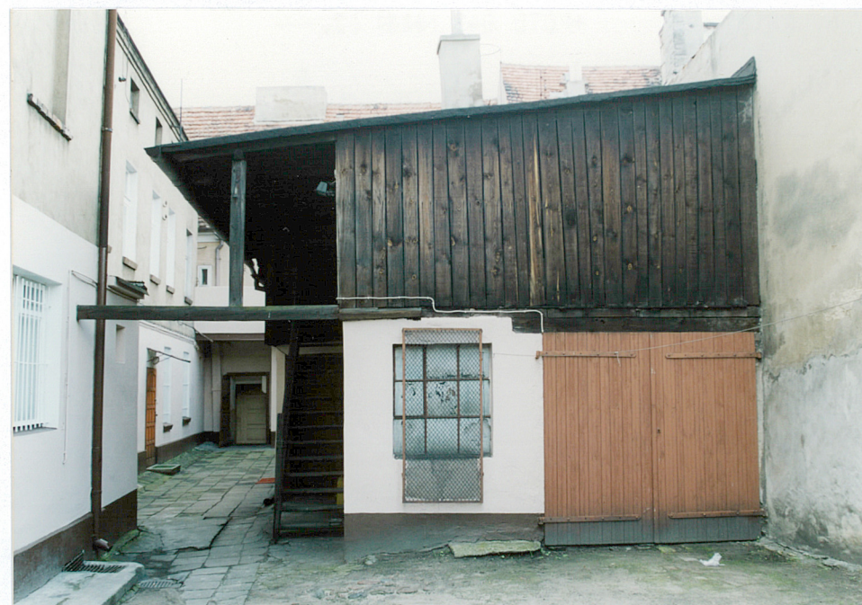
4. Oficyna północna – przybudówka od strony wschodniej