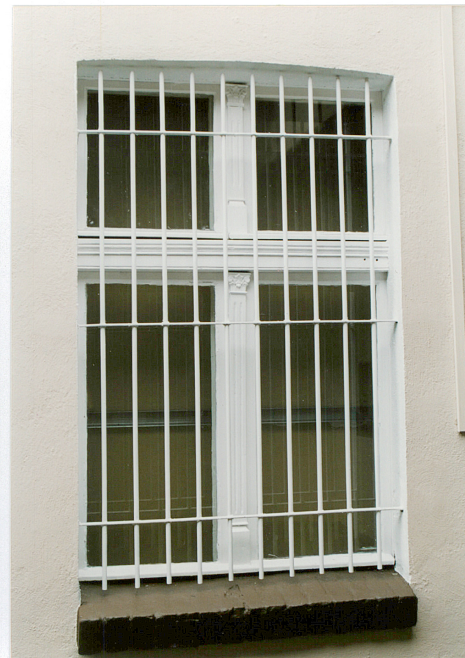
7. Oficyna południowa - okno