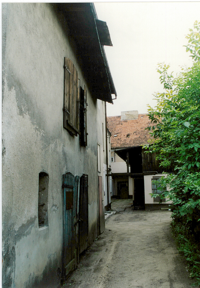
6. Oficyna południowa - budynek gospodarczy