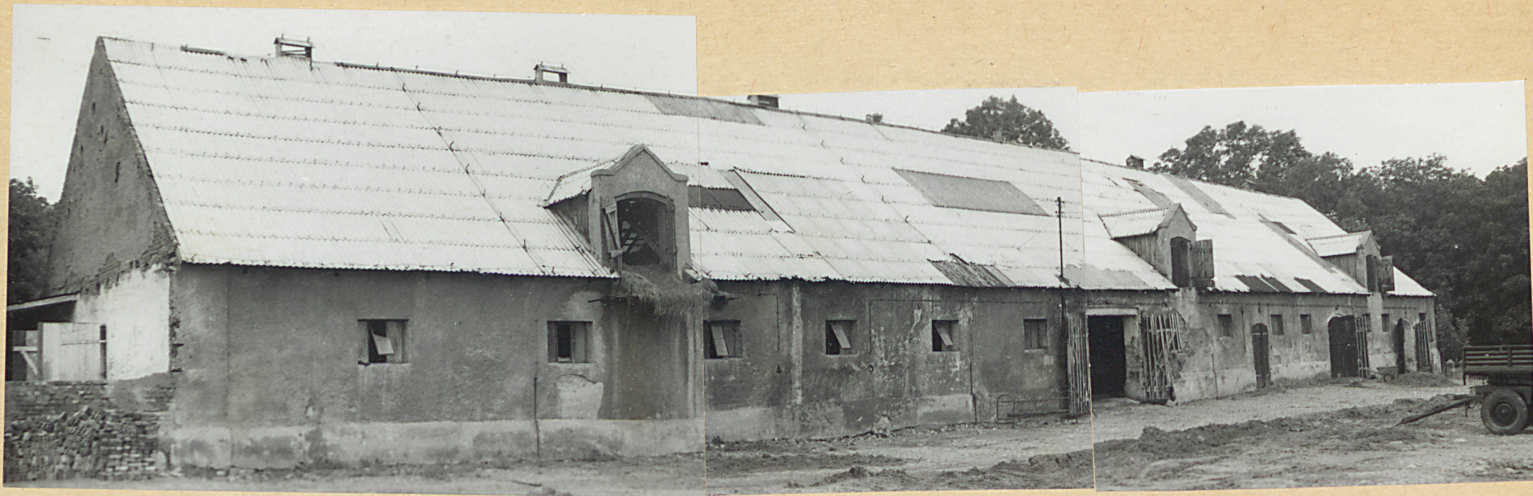
E L E W A C J A W S C H O D N I A