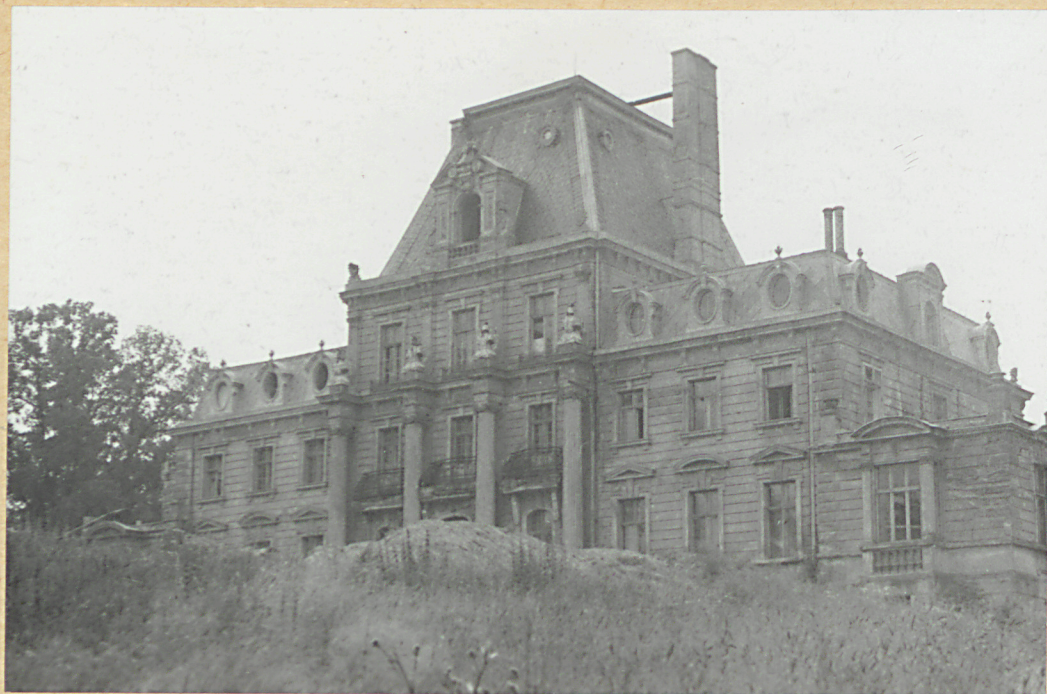
Pałac - elewacja frontowa (widok od N-E)