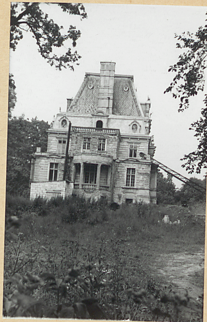
Pałac - widok od płd