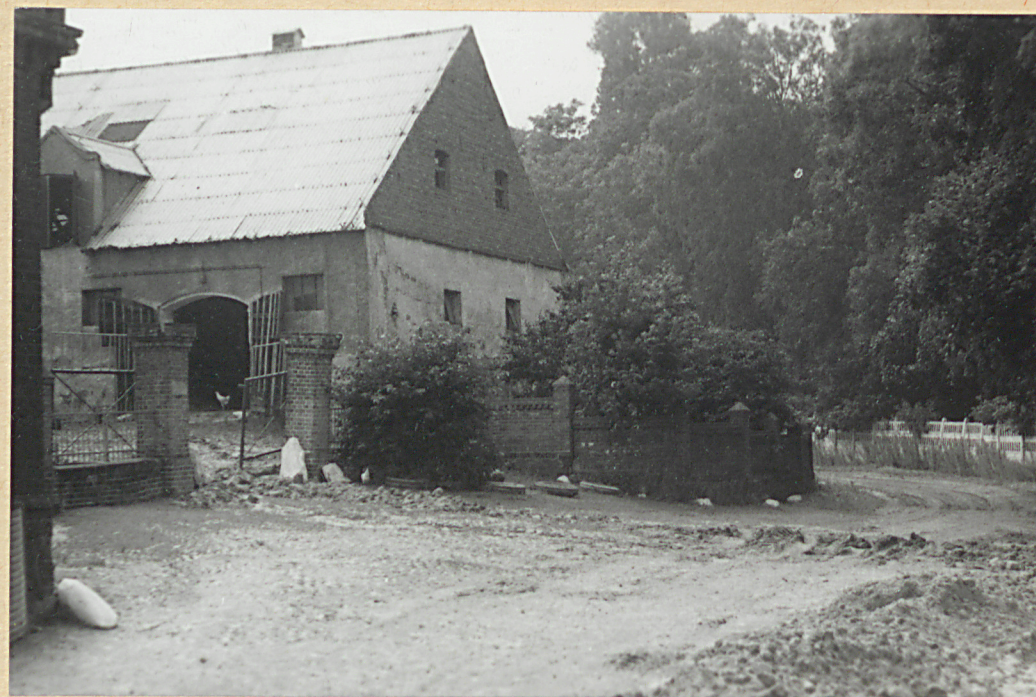
Główna brama wjazdowa (widok od N-E)