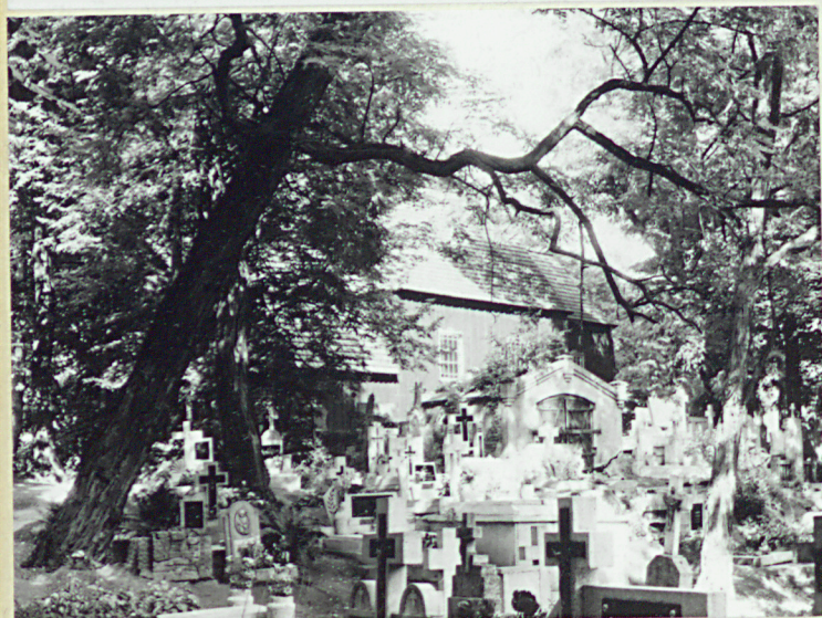
data wykonania 5.09.1985 miejsce przechowywania negatywów WKZ w Poznaniu.

380/A 25.M Nr 1. III 680/277/ data 1968 168.