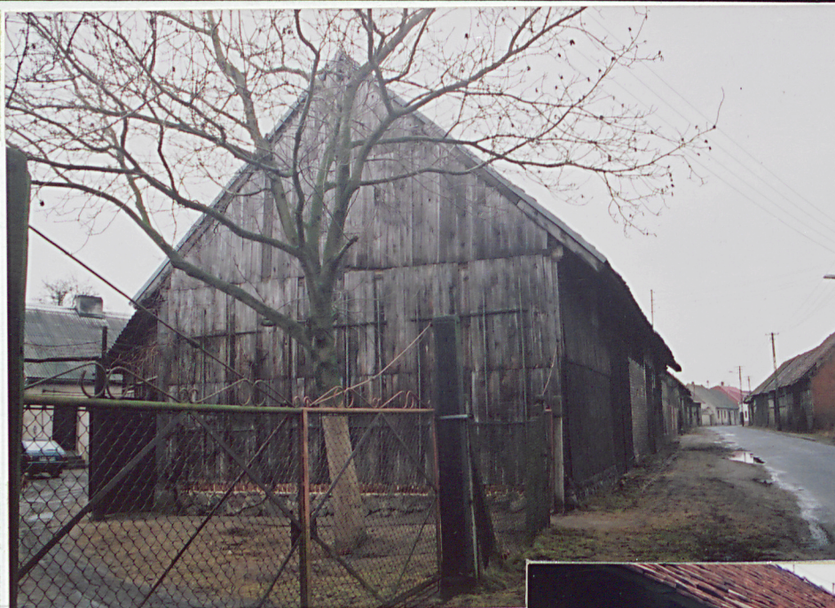
3. Elewacja szczytowa południowa.