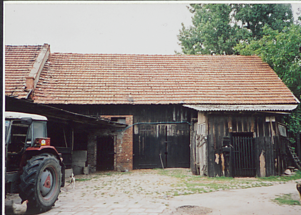
2. Stodoła południowa (dz.891/1, 893/1) - elewacja tylna (zachodnia) - od podwórza.