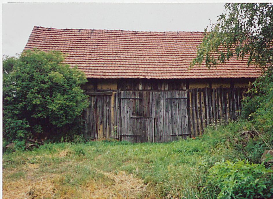
4. Stodoła północna (dz.889) - widok ogólny elewacji tylnej (zachodniej).