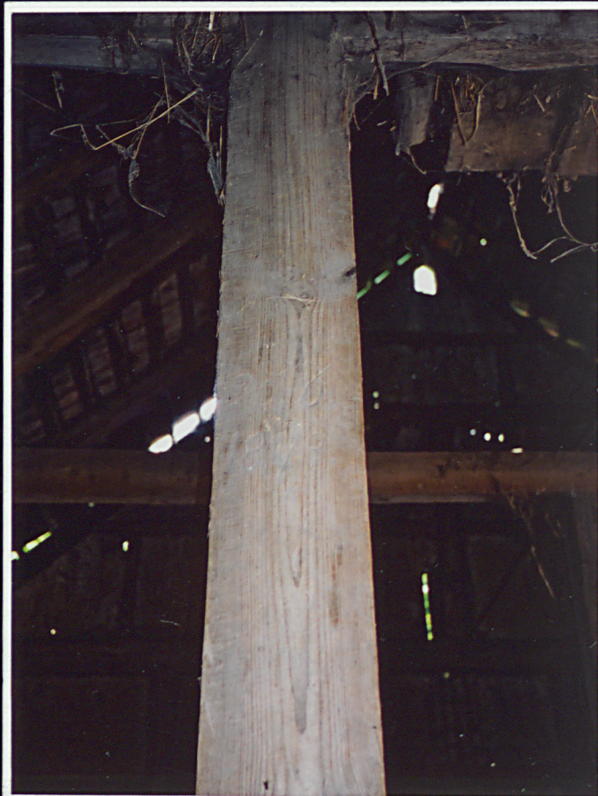
M, Data na słupie we wnętrzu stodoły "25.6 | 1879."