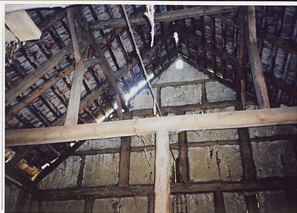
8, Wnętrze stodoły - widok na ścianę szczytową południową - więzar pełny w środkowej części saseika.