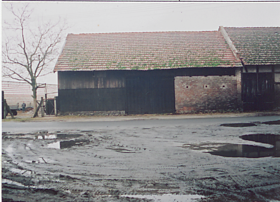
6. Elewacja wschodnia - od drogi - część południowa.