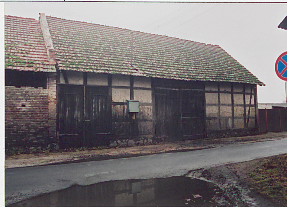
7. Elewacja wschodnia - od drogi - część północna.

Wkładkę założył: Urszula Bauman, 2003 r. (imię, nazwisko, data)