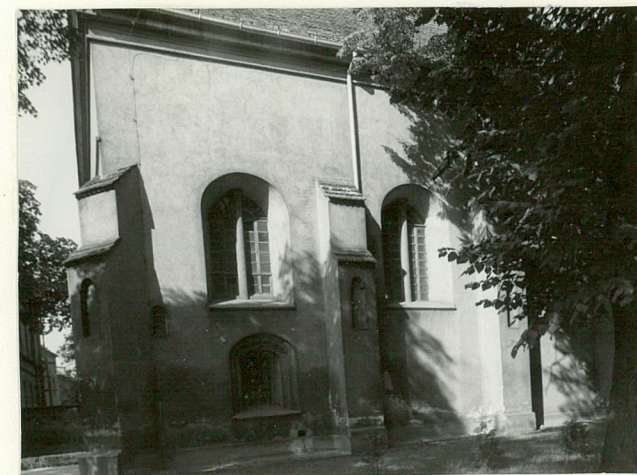
Elewacja wsch., skarpy