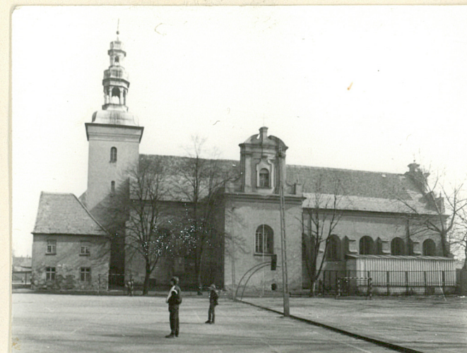
Elewacja od strony zach.