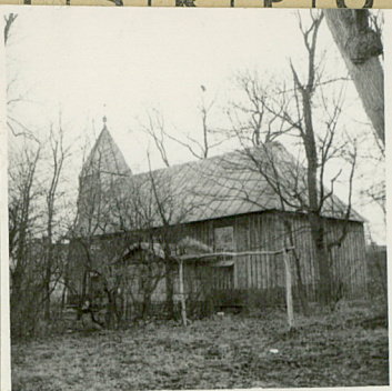
Widok od strony prezb.

Zwrócony ku zach. Drewniany, o konstr. słupowej, w wieży szkieletowej, oszalowany. Na planie prostokąta trójosiowy z zakręstą z pruskiego muru od pn. i kruchty od zach. nad którą wchodzi, kwadratowa w ruinie wieża. Po bokach słupy z zastrzałami przenikającymi przez strop. Empora organowa wygięta, na 21 słupach. Dach truspałowy, kryty blachą, wieża nakryta blachem namiotowym blaszanym.