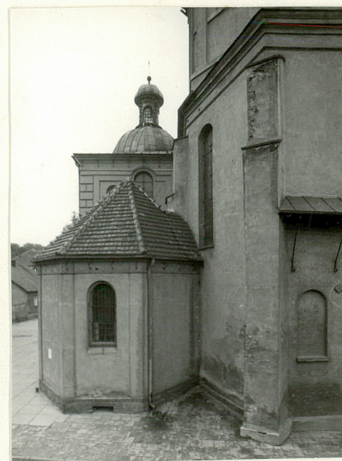
zakrystia od strony wsch