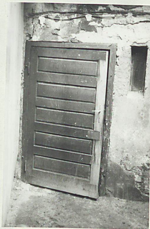
fot. 5 - drzwi tylne