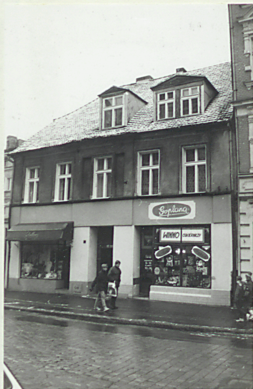
fot. 2 - elewacja frontowa /pn./