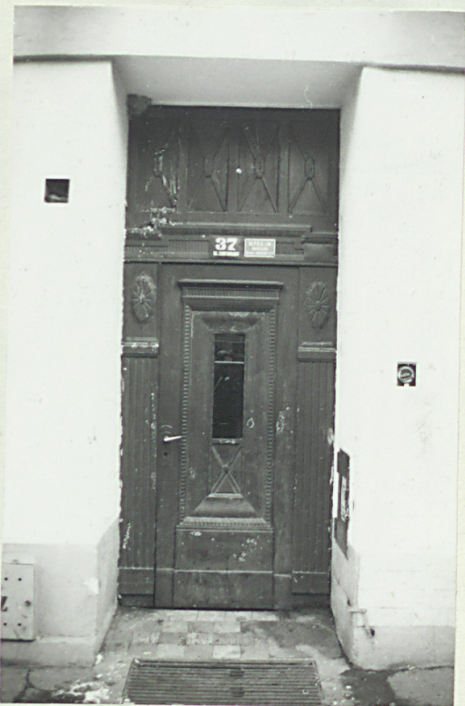
fot. 4 - drzwi frontowe