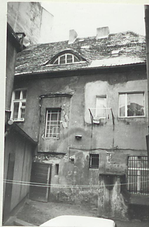
fot. 3 - widok od podwórza