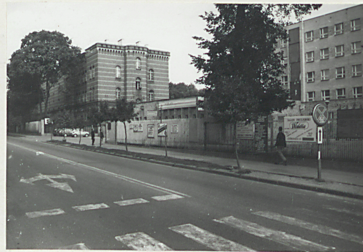
fot. 1 - widok na koszary z ul.Sobieskiego