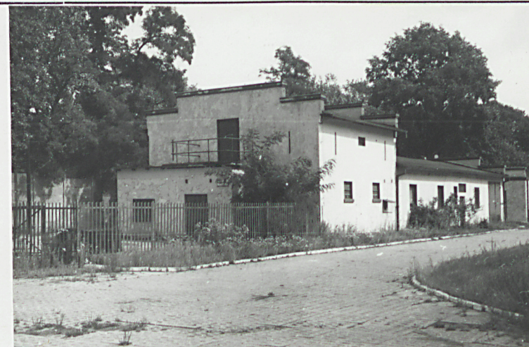
fot. 5 - stajnia /6/