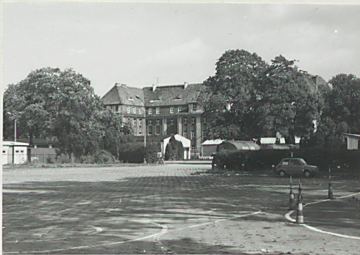
fot. 9 - blok koszarowy /15/