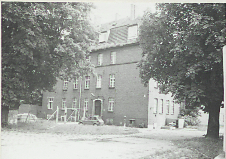
fot. 8 - garn. węzeł łączności /13/