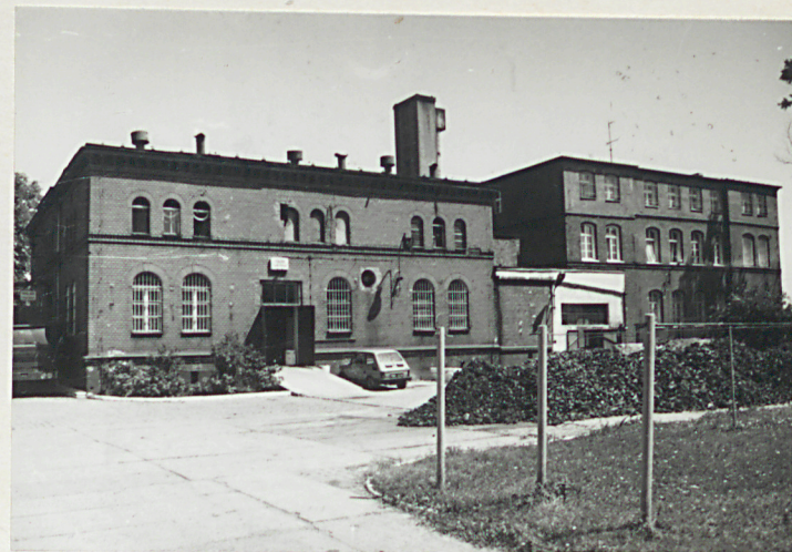
fot. 10 - WKU i pralnia