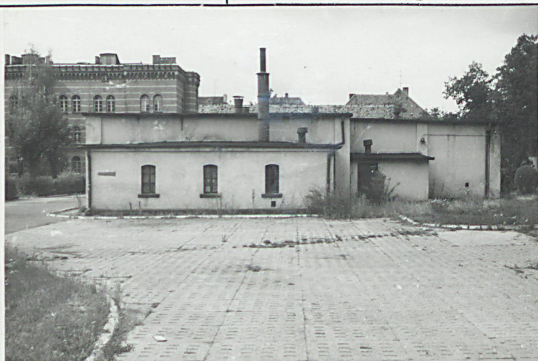
fot. 4 - magazyn /5/

3. Zawartość wkładki (nazwa obiektu lub materiału uzupełniającego) fotografie