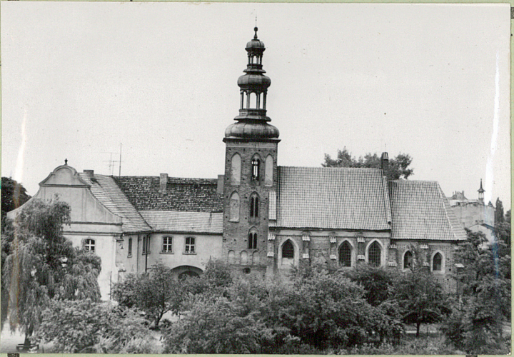
35. Uwagi różne