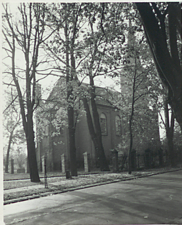
widok od str. pn - wsch