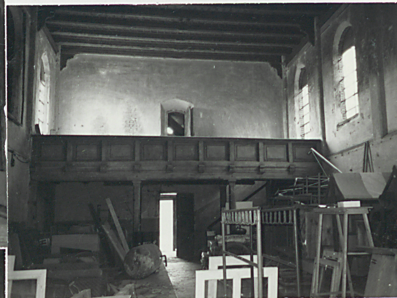
widok na część zachodnią z emporą