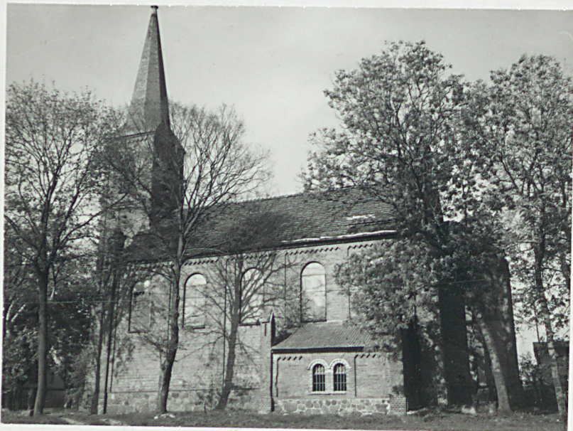
widok od str. pd