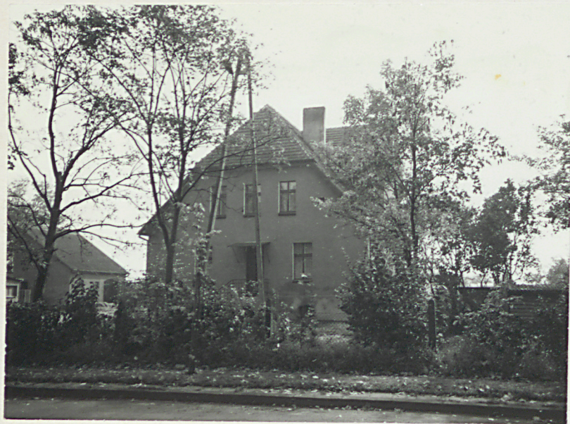
od str. ulicy pastorówka od str. kościoła