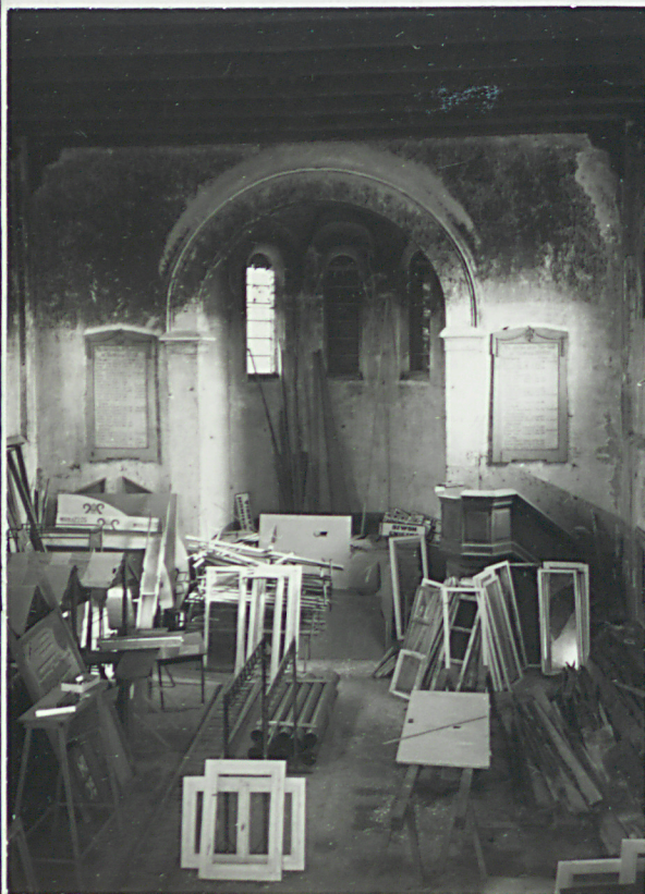
widoki w kierunku wschodnim i sklepienie chóru

3. Zawartość wkładki (nazwa obiektu lub materiału uzupełniającego) fotografie