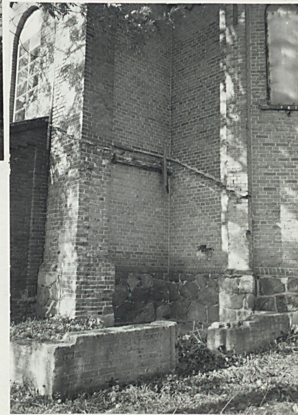
istniejący cokół przybudówki