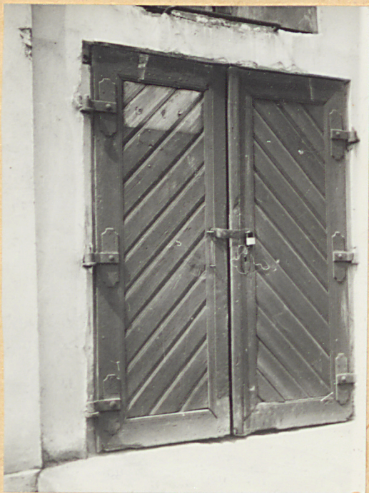
4. Dwa wyjściowe glazne.