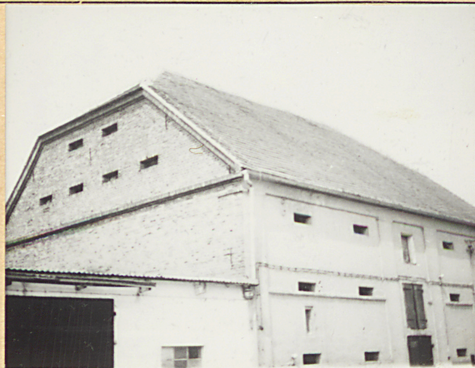
1. Szczyt od strony pd.