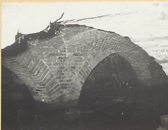
3. Sklepienie piwnicy.