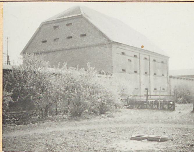
2. Elewacja wsch. i szczytowa pn.