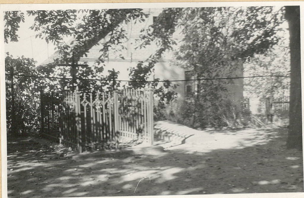
2. PŁYTA Z 1865. W OGRÓDZENIU