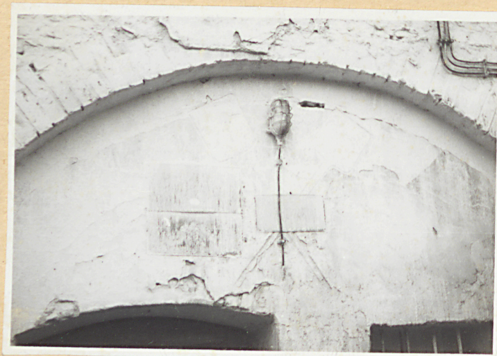
2. Fragment płyciny. mieszczącej drzwi.