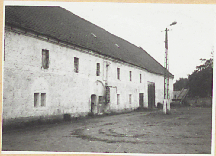
3. Elewacja frontowa fragm.