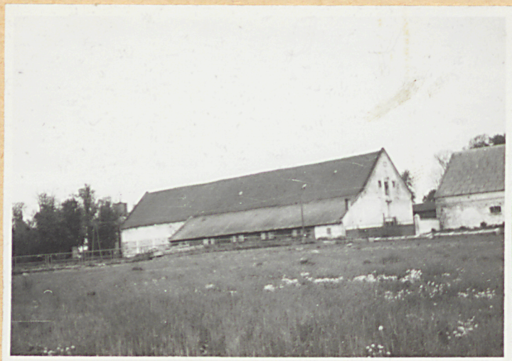
1. Elewacja południowa.