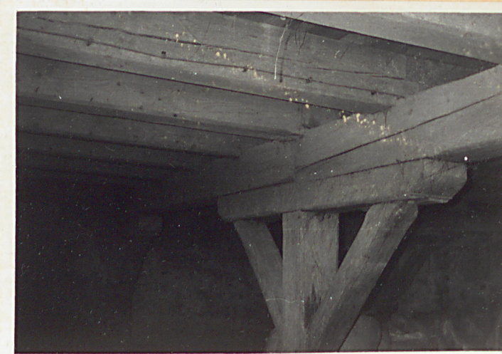
4. Fragment stropu spichlerza I kondyg.