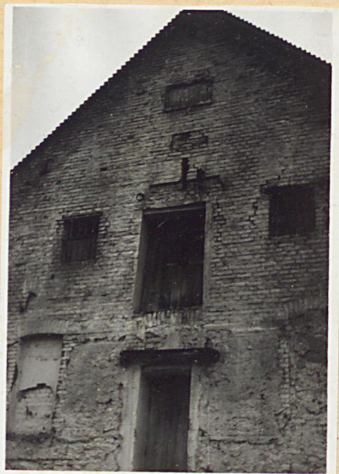
1. Elewacja szczytowa wsch. fragment.